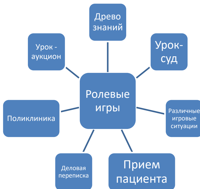
Рисунок 2 – Формы ролевой игры

В своей работе мы использовали следующие формы уроков по организации ролевой игры (рисунок 2).