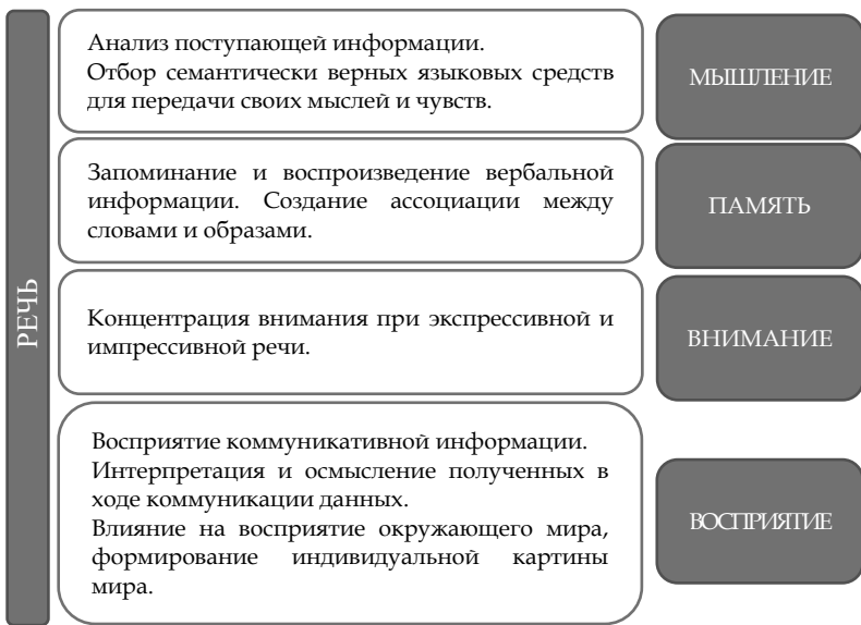
Рисунок 4 – Взаимосвязь речи и других психических функций

Таким образом, речь является важным инструментом, который способствует развитию и функционированию других психических процессов, таких как мышление, память, внимание и восприятие. В свою очередь, эти процессы влияют на формирование и развитие речи.