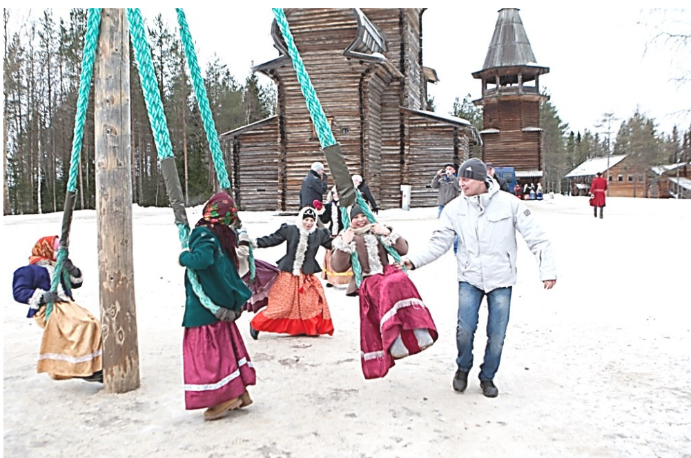
Карусель на столбе. Реконструкция на территории архитектурно-ландшафтной экспозиции в музее «Малые Корелы». 2016 г.

Бегунки. В традиционной России популярностью пользовался и другой вид карусели – «бегунки» («гиганы», «гигантские шаги»). Его конструкция закрепляется на столбе и является прообразом веревочных (подвесных) каруселей. Устраиваются бегунки достаточно просто: вкапывается в землю столб (шест), вверху шеста закрепляется колесо или подвижная крестовина, от крестовины спускают веревки.