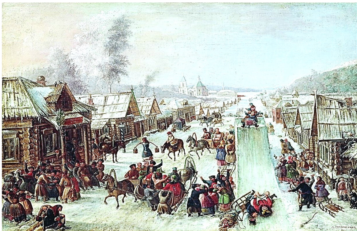
Ну и масленица! Л. И. Соломаткин. 1878 г.

Катание с ледяных гор считалось не только забавой на всей территории Руси, но и действием, полным тайного смысла. Люди верили, что при скатывании у человека ускоряются жизненные токи, а в земле пробуждается животворящая энергия будущей весны. Поэтому существует версия, что рождение аттракциона «катальные горы» имеет русские корни [28, с. 136].