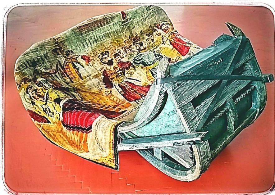
Сани кошевки. МБУК Каменский районный краеведческий музей г. Камень-на-Оби.

вой площади разворачивалось масленичное представление заезжих музыкантов, певцов, фокусников, комедиантов, кукольников.