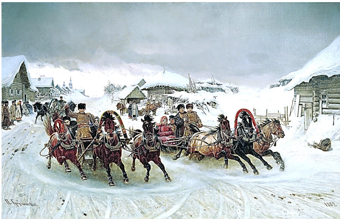
Масленица. П.Н. Грузинский 1889 г.

останавливаться по первому их требованию, чтобы принять пожелания и поцеловаться при всем честном народе.