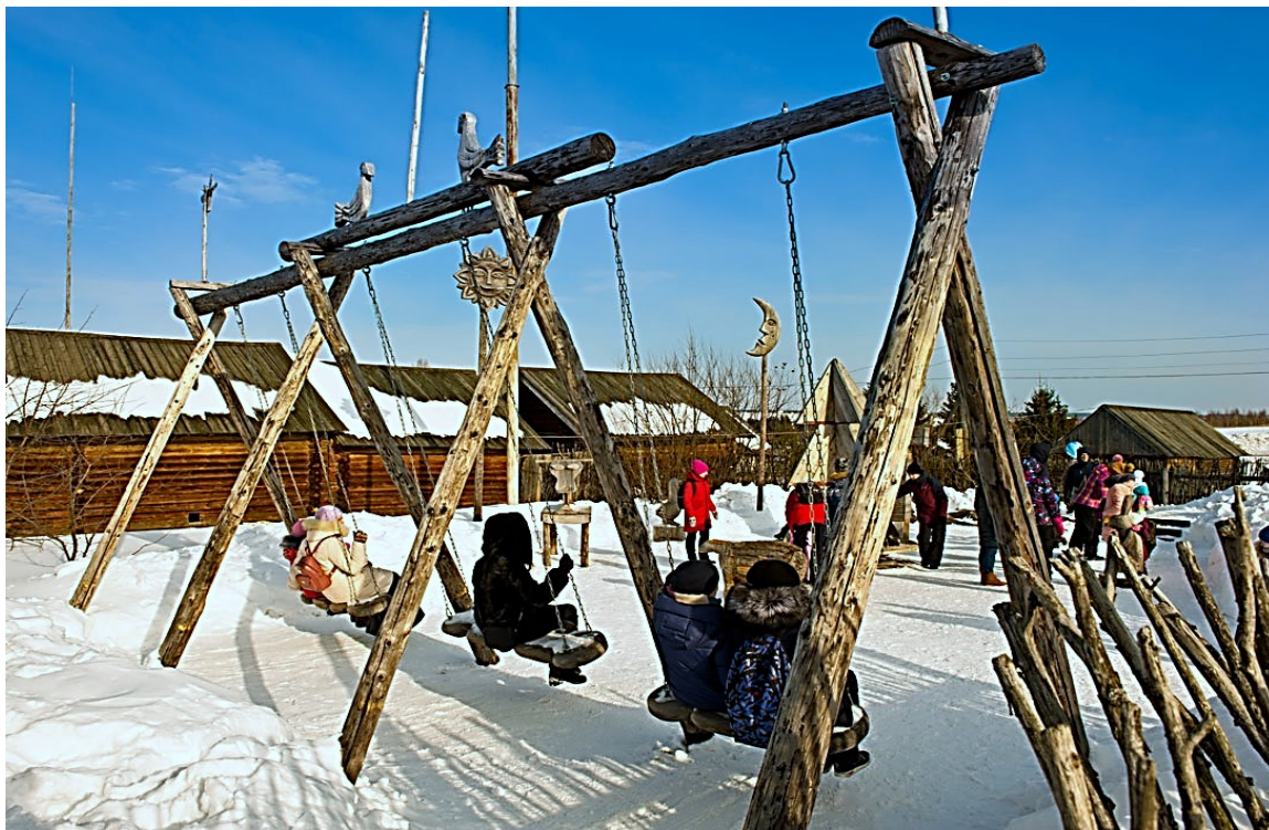
Качели на Масленицу. Реконструкция в Музее-заповеднике «Лудорвай». Удмуртия, Ижевск

говращением на карусели и взлетами на качели подражали годовому движению Солнца, способствуя быстрейшему расцвету жизнетворных сил и восславляя главный источник тепла и света [27, с. 142].