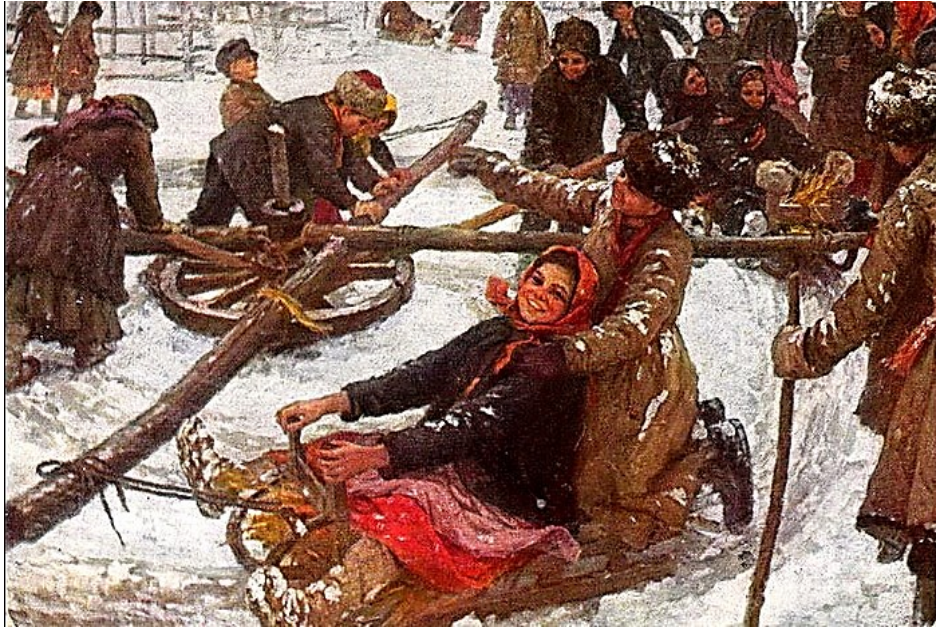
Деревенская карусель. Ф.В. Сычков. 1910 г.