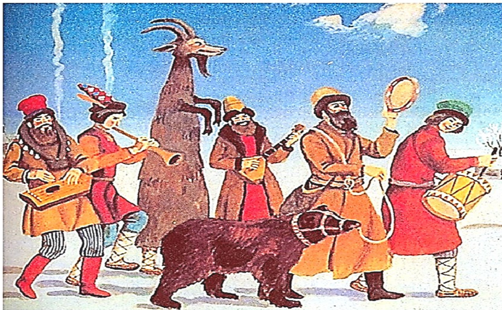
Скоморохи с медведем и козой В.И. Семенов. 1989 г.

вдруг начинало копать. В том месте, где медведь копал землю, находили кости или волосы – заговорённые предметы. Обнаруженные предметы сжигали, скот выздоравливал, а зверь получал награду – стол с мёдом, ягодами и фруктами [36].