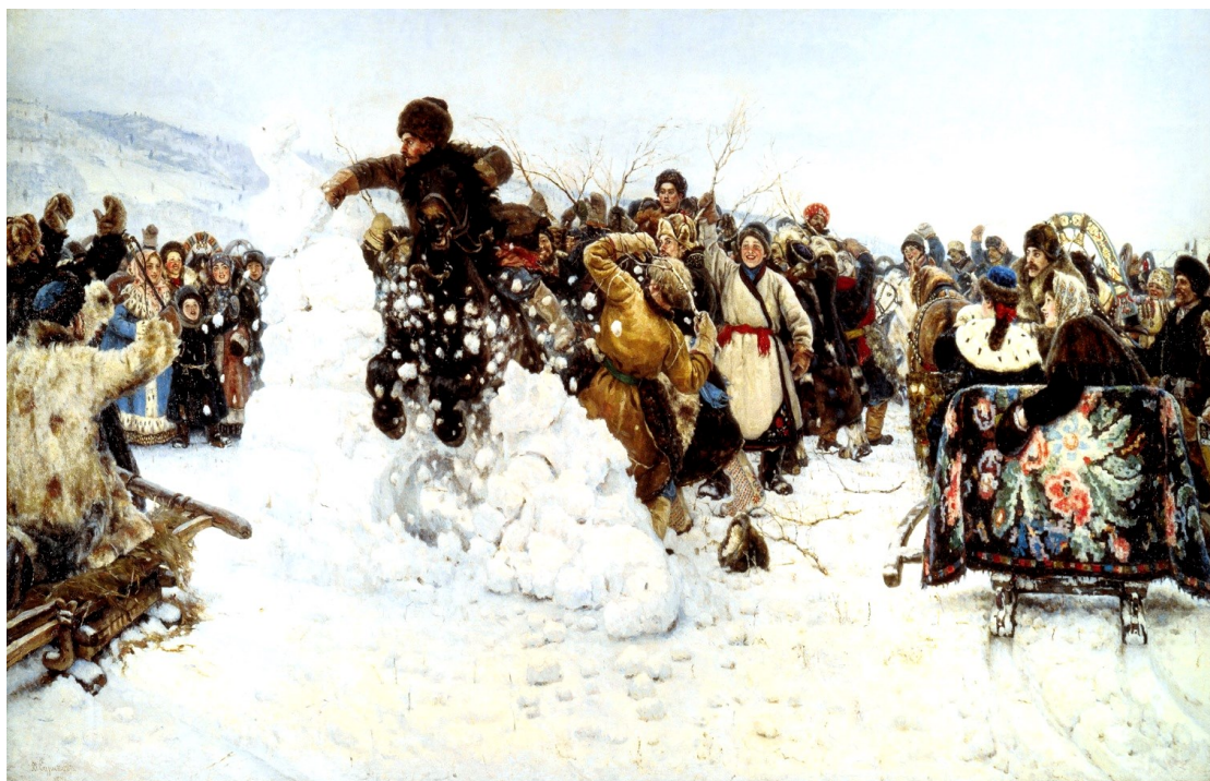
«Взятие снежного городка». В. Суриков. 1891 г.