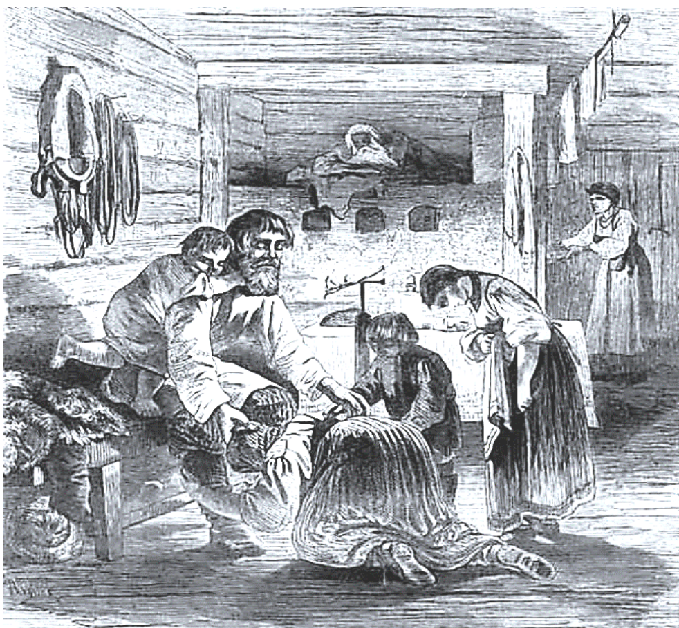
Прощеный день в христианской семье. Гравюра К.Кржижановского по рисунку И.И. Соколова. XIX век.

Близкие, да и более далекие от родства люди просили друг у друга прощения за все причиненные им обиды и неприятности.