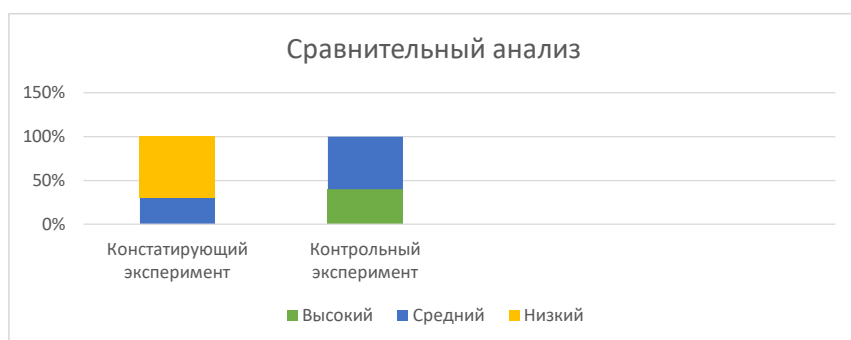
Рисунок 3. - Сравнительные результаты диагностики детей на этапе констатирующего и контрольного эксперимента

Таким образом, результаты контрольного эксперимента подтверждают эффективность проведенного формирующего эксперимента и правильность выдвинутой гипотезы исследования, это подтверждается на Рисунке 4.