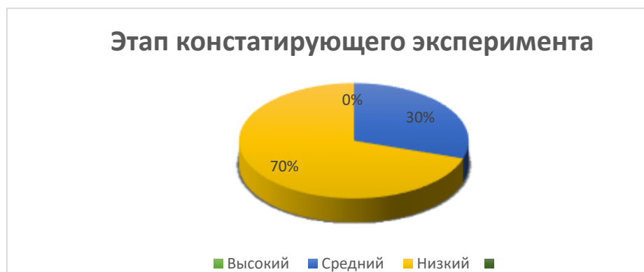
Рисунок 1. - Результаты диагностики по выявлению уровня сформированности развития мелкой моторики у детей раннего возраста на этапе констатирующего эксперимента.

Таким образом, проанализировав результаты констатирующего этапа эксперимента, был сделан вывод о необходимости организации определенной системы работы по развитию ручной моторики в группах детей раннего возраста.