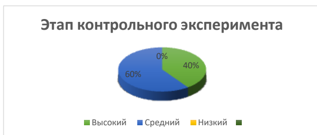
Рисунок 2.- Результаты диагностики уровня развития умелости детей на контрольно-экспериментальном этапе.

Сравнение результатов диагностики детей на контрольно-экспериментальном этапе представлено в таблице 12.