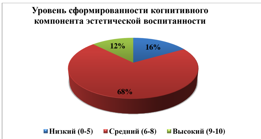
Рисунок 3 – Уровень сформированности когнитивного компонента эстетической воспитанности младших школьников

По результатам анализа «Сводного листа была составлена диаграмма, представленная на рис. 3.