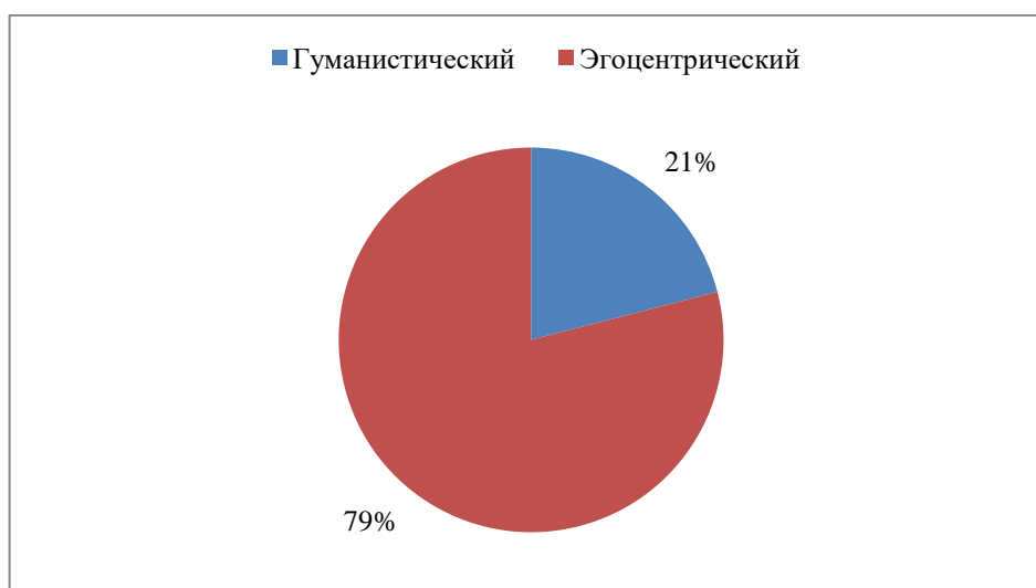
Рисунок 2 – Характер эмпатии испытуемых

Из данной диагностики следует, что 17 % испытуемых имеет эгоцентрический характер эмпатии, а у 83 % детей проявляется гуманистический характер эмпатии (рисунок 2).