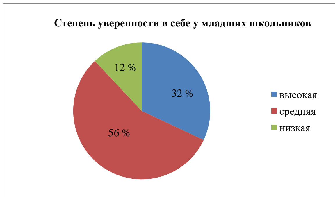
Рисунок 3 – Результаты показателей степени уверенности у младших школьников по методике Б. Д. Карвасарского

Ниже в качестве диаграммы представлены обработанные результаты степени уверенности в себе у младших школьников (см.рис.3).