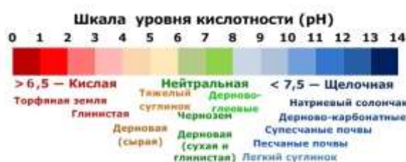
Рисунок 1.1 – Шкала кислотности

В пробирку поместить почву 1-2 см. Прилить к почве 4-5 см 3 прокипяченной воды. Пробирку закрыть пробкой и в течении 2-3 минут встряхивать. Затем дать раствору отстояться 2-3 минуты. Не взбалтывая профильтровать в чистую пробирку с помощью бумажного фильтра и воронки. После завершения фильтрации почвенный раствор нанести стеклянной палочкой на индикаторную бумагу. Определить показатель по шкале уровня кислотности. Сделать вывод о реакции почвы.