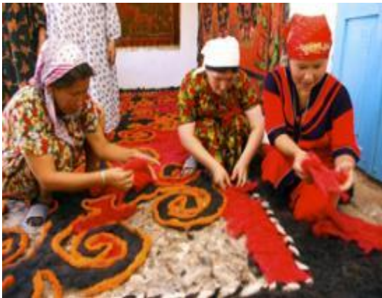
Мастер-классы по изготовлению