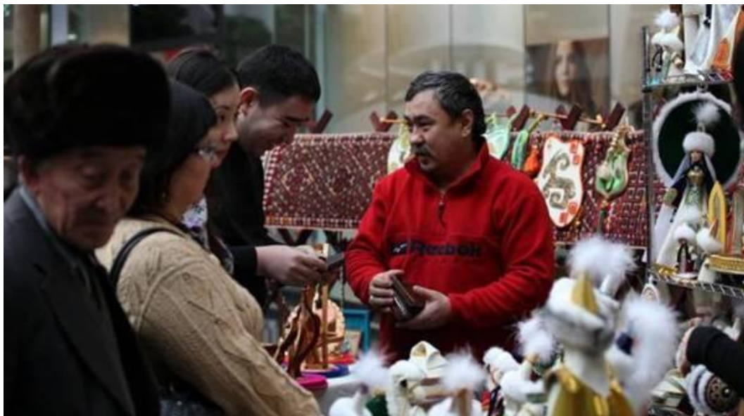
Бутики сувенирной продукции