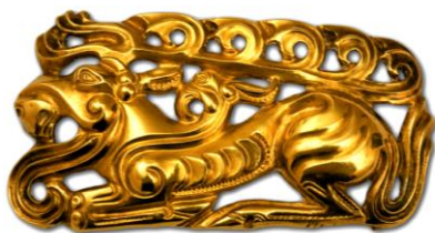
детали костюма из ЗОЛОТА