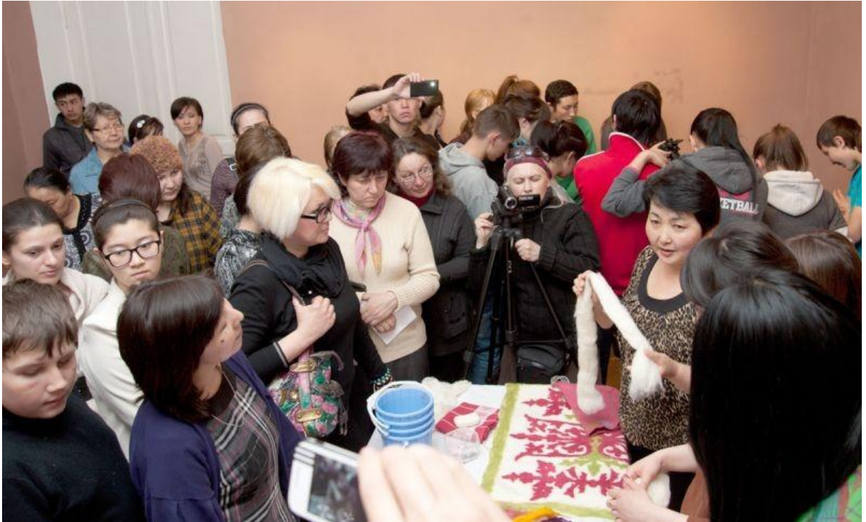
и ее сувенирная продукция из войлока