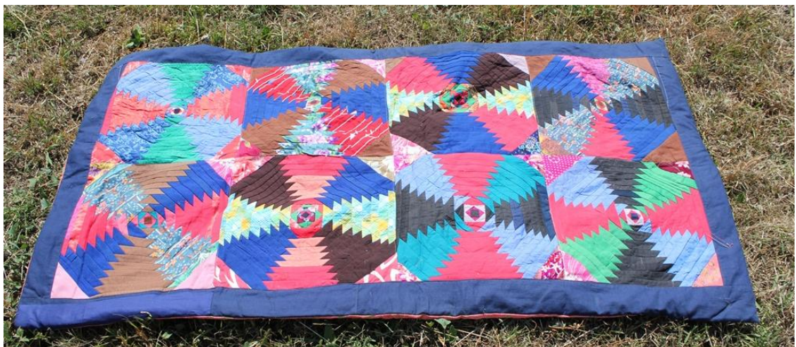
Корпе – лоскутные одеяла