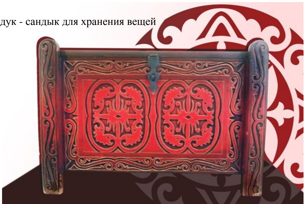
Резной сундук - сандык для хранения вещей