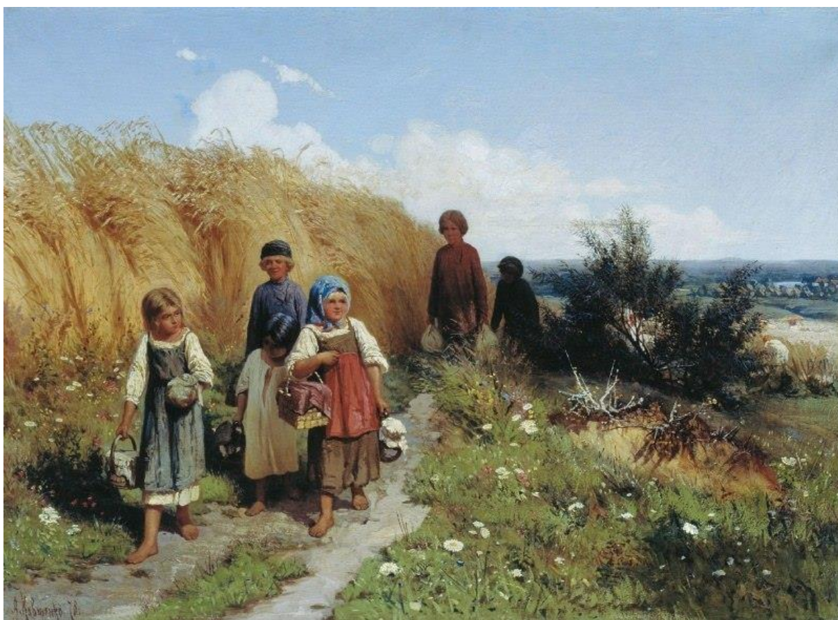
Кившенко А.Д. Жнитво. 1878 г. 143