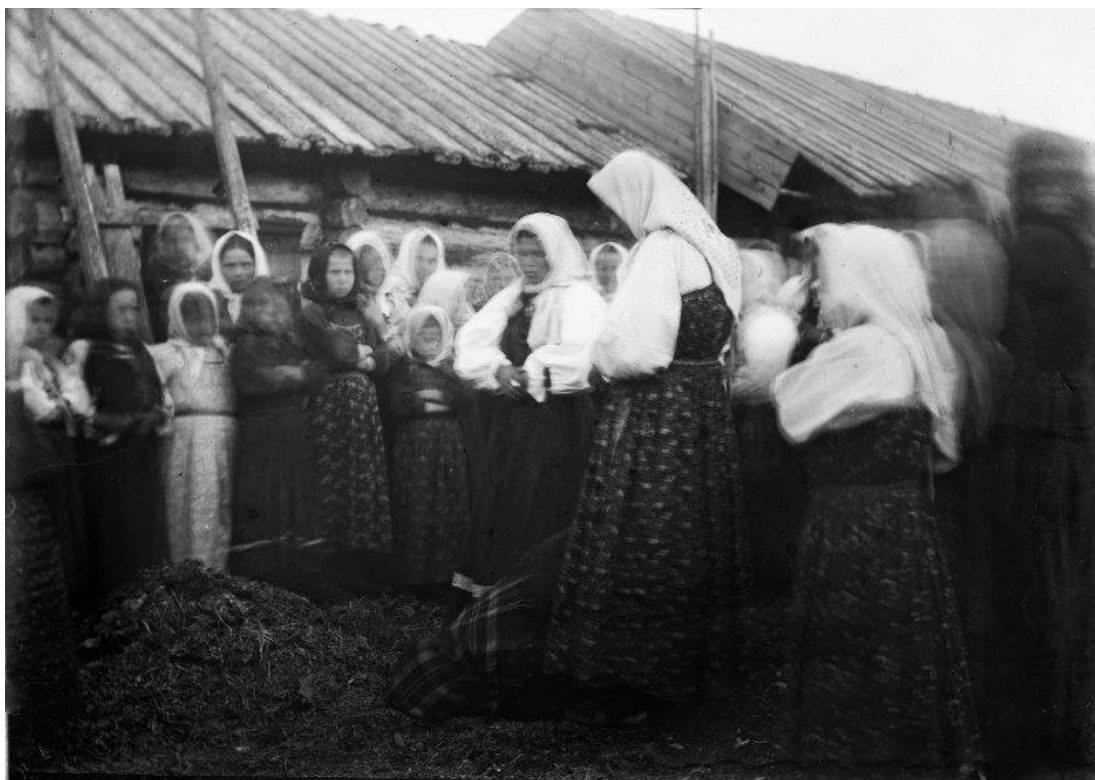
Крестьянские девочки Пинежского уезда Архангельской губернии 149