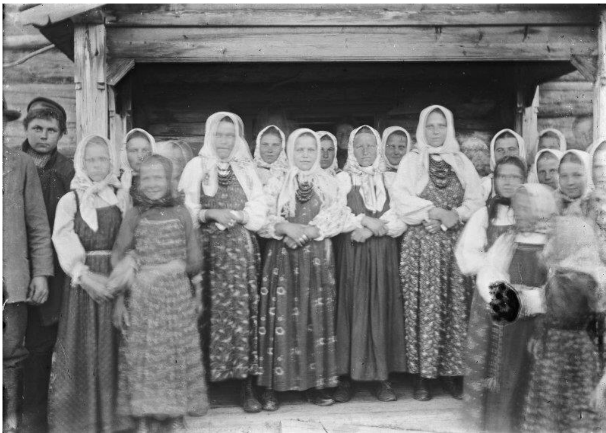
Девушки-«кокушницы» на празднике «метище». Село Карпогоры Пинежского уезда Архангельской губернии 150