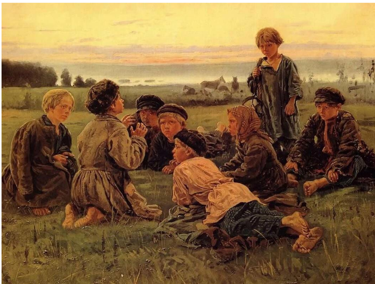
Маковский В.Е. Крестьянские мальчики в ночном стерегут лошадей.1869