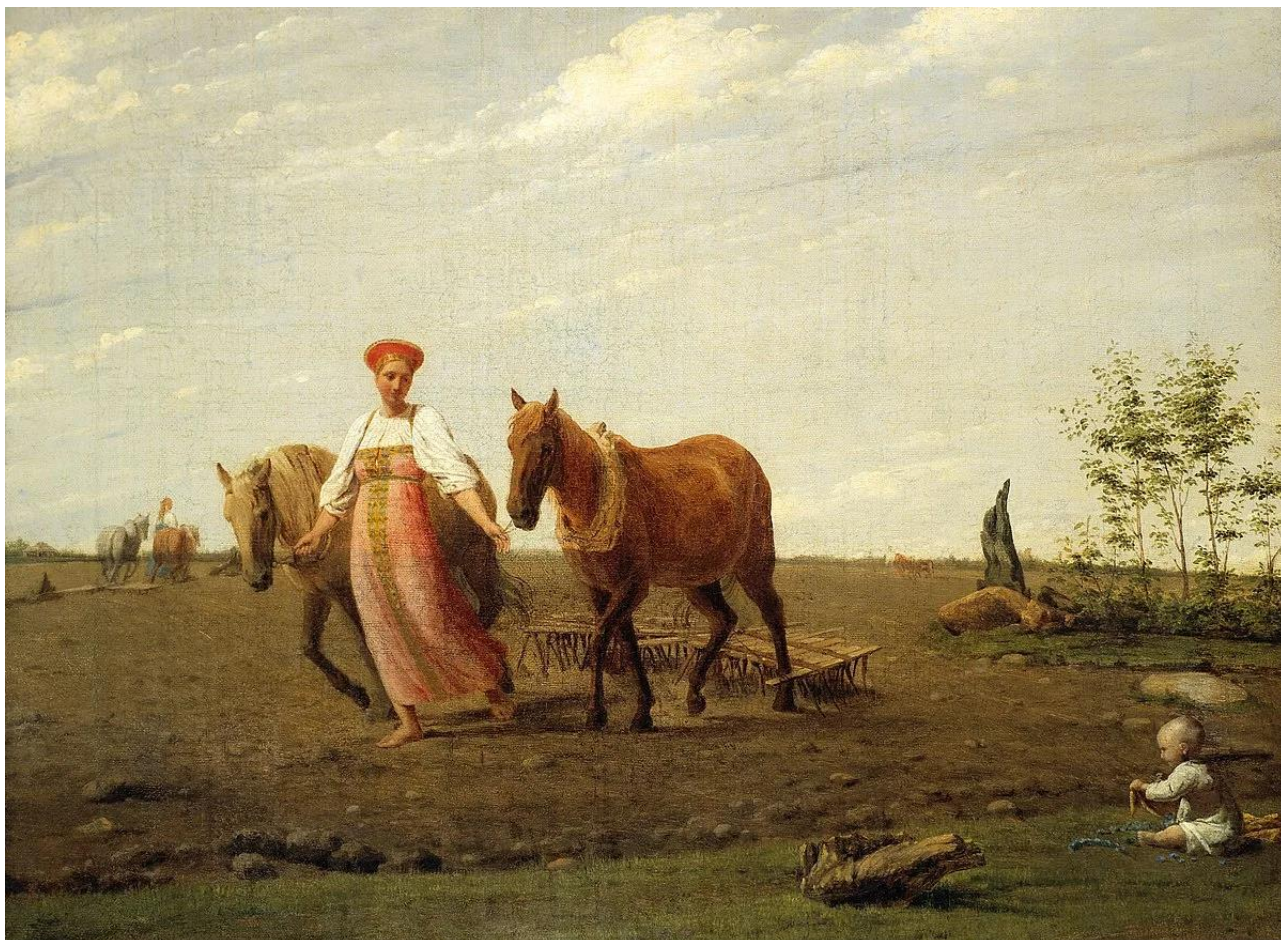
Венецианов А.Г. На пашне. Весна. 1820 г. 141