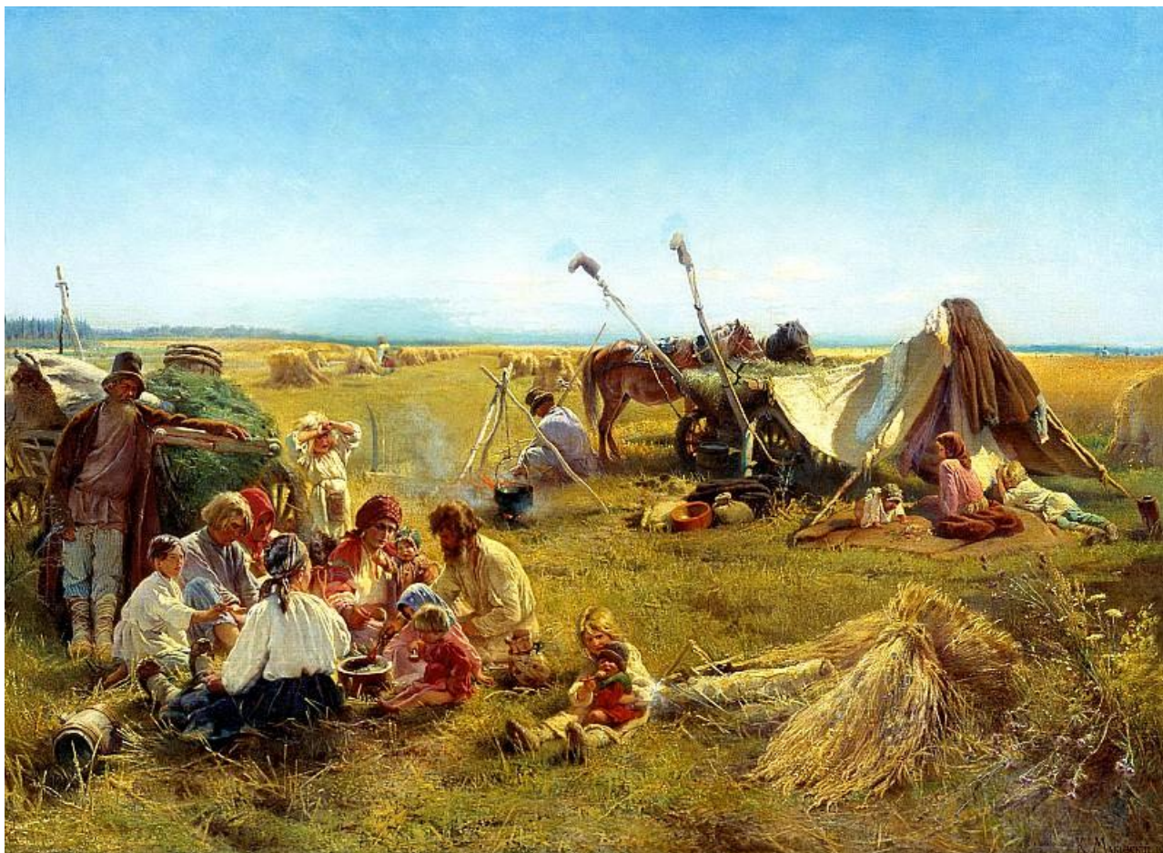
Маковский К.Е. Крестьянский обед в поле. 1871 г. 144