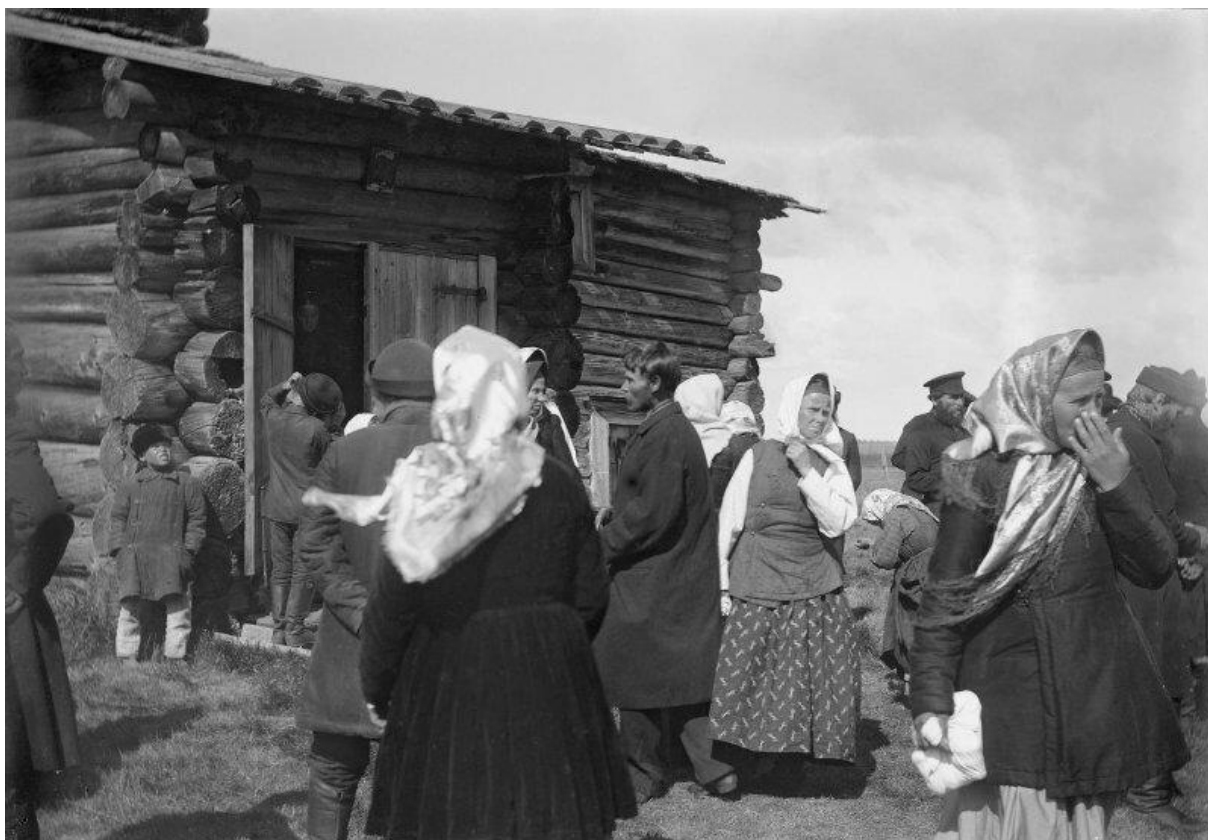
Крестьяне около входа в церковь. Пинежский уезд Архангельской губернии 152