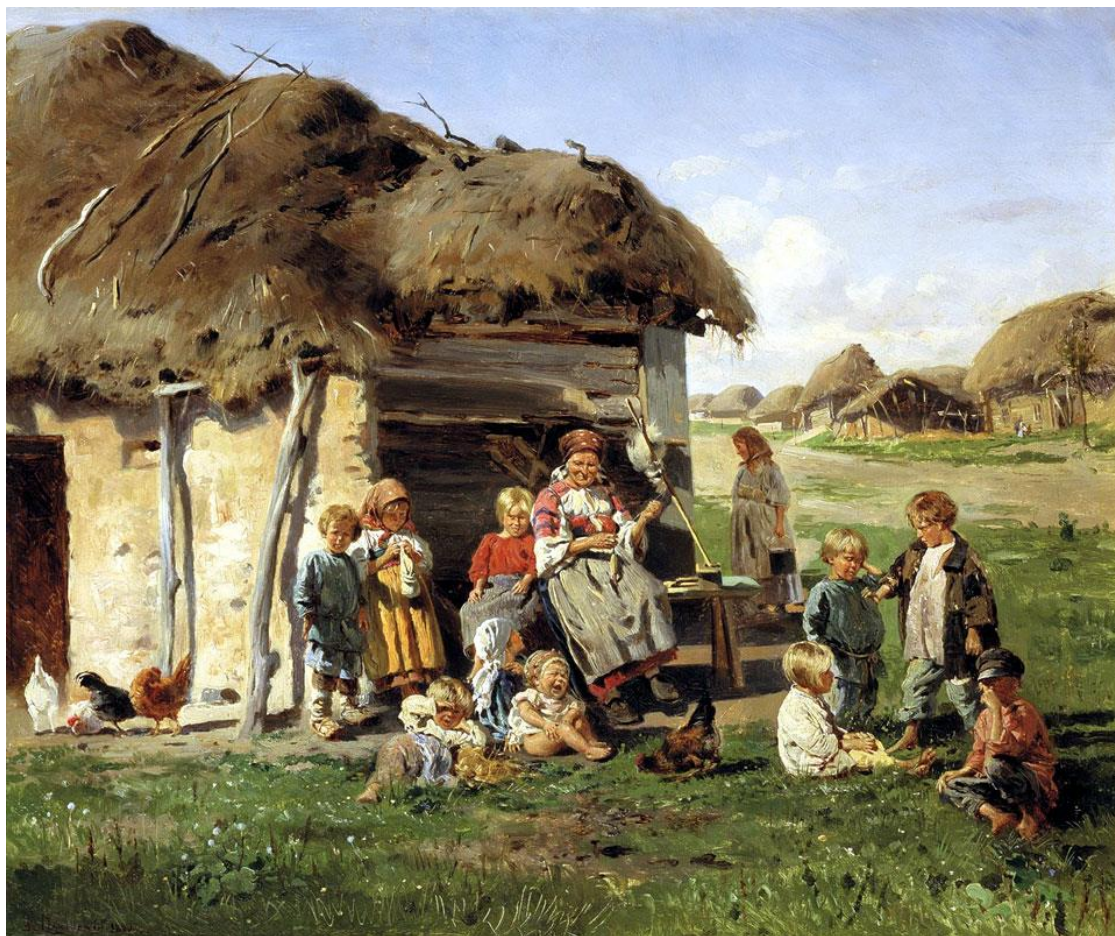
Маковский В.Е. Крестьянские дети. 1890 г. 146