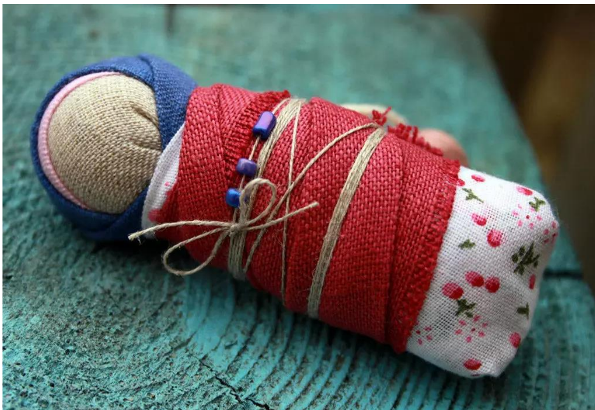
Кукла - пеленашка 148