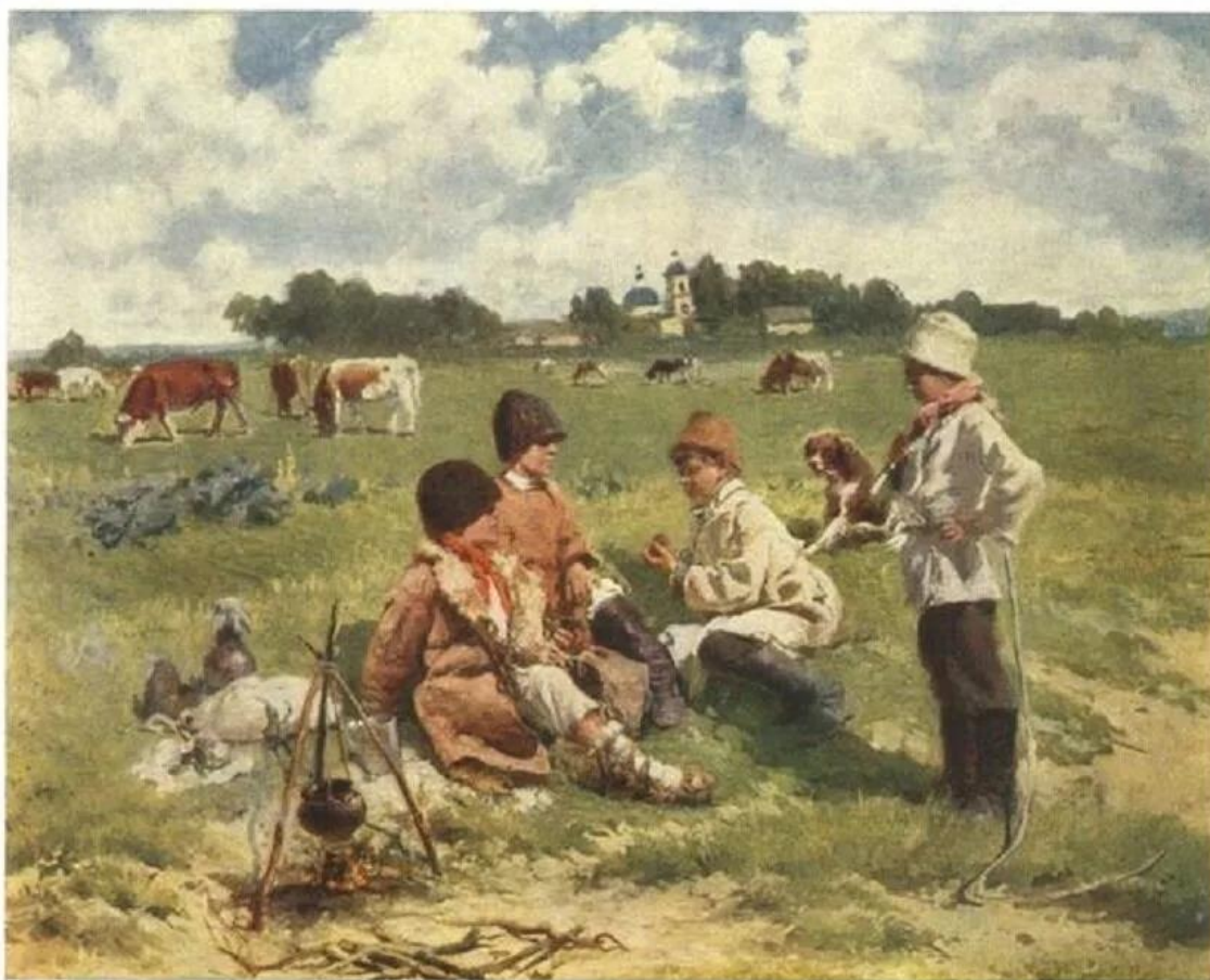
Маковский В.Е. Пастушки. 1903 г. 147