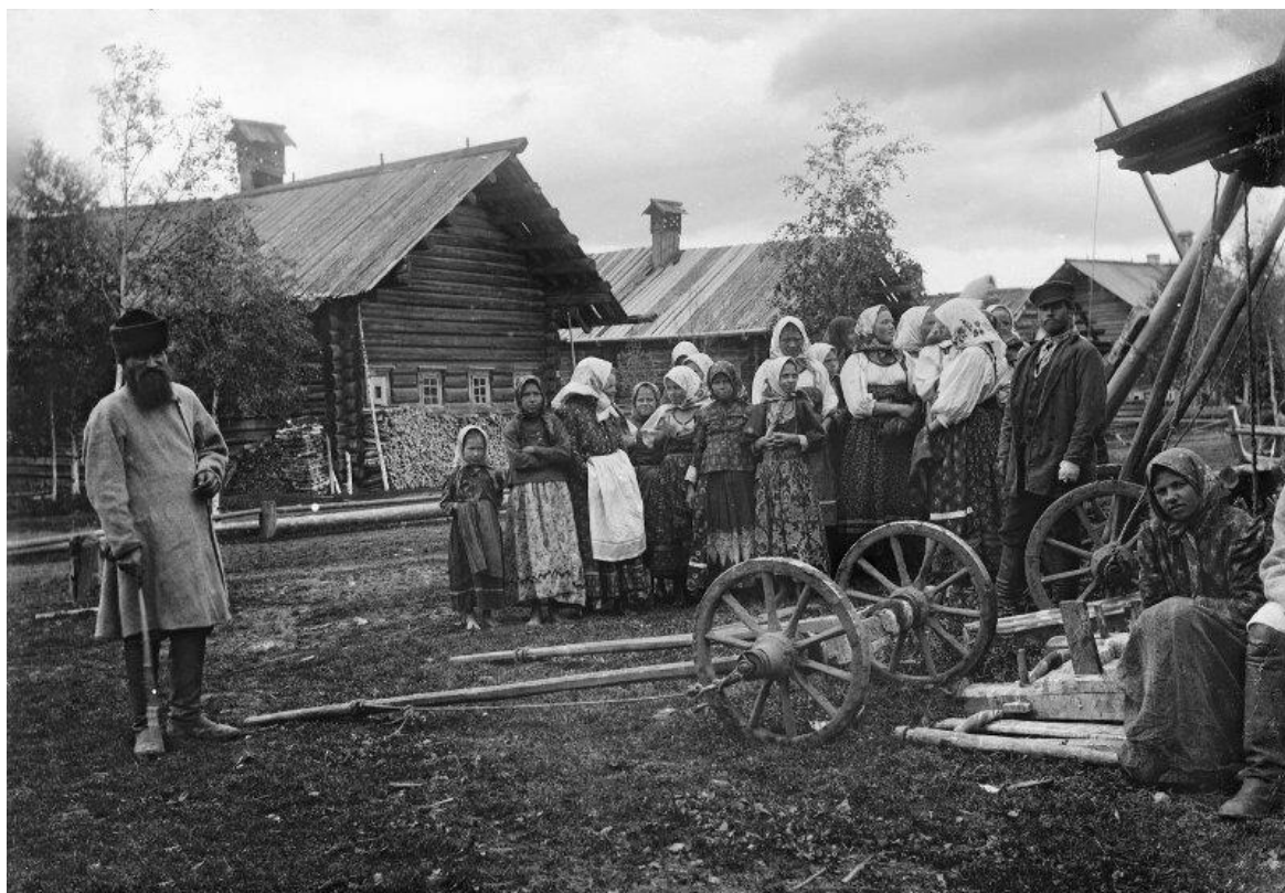
Крестьянские девушки около мастерской плотника. Пинежский уезд Архангельской губернии 151