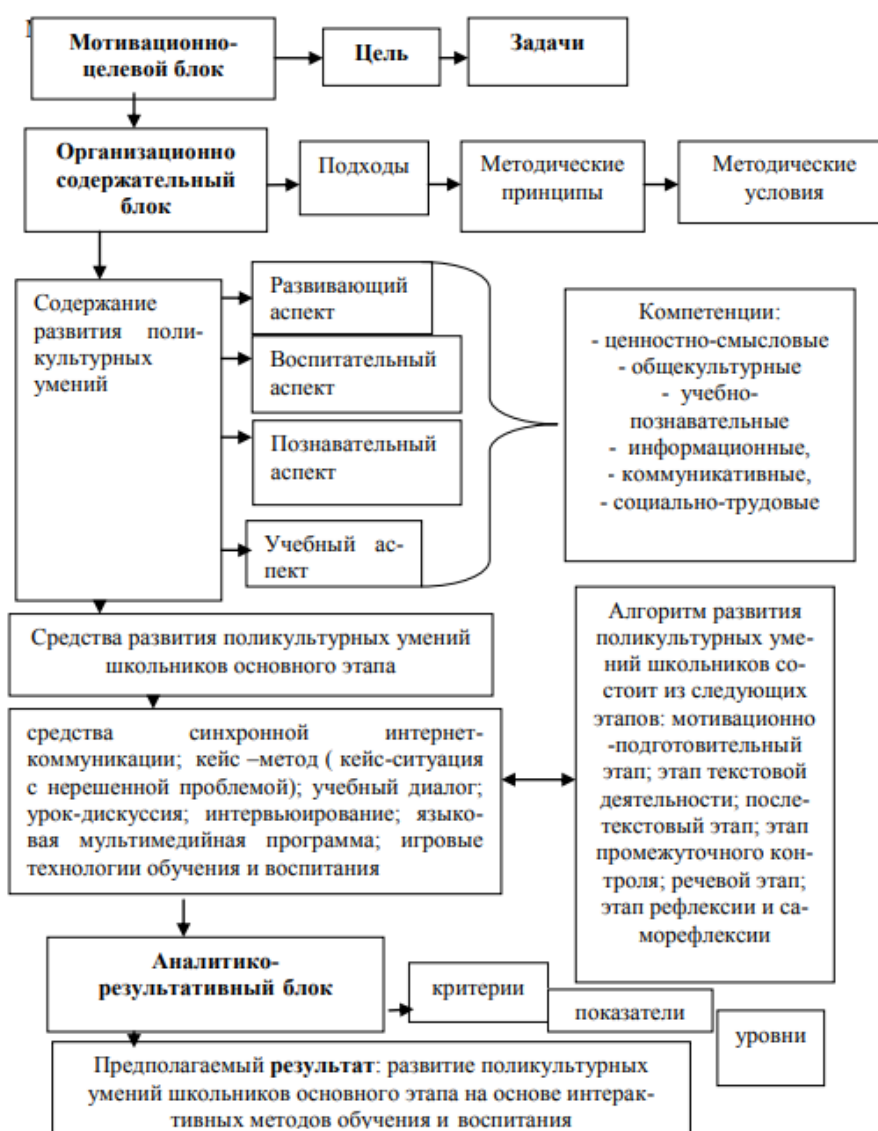
Рис.1. Модель формирования развития поликультурных умений школьников на основе интерактивных методов обучения

Подробная модель формирования развития поликультурных умений школьников на основе интерактивных методов обучения представлена на рис.1.