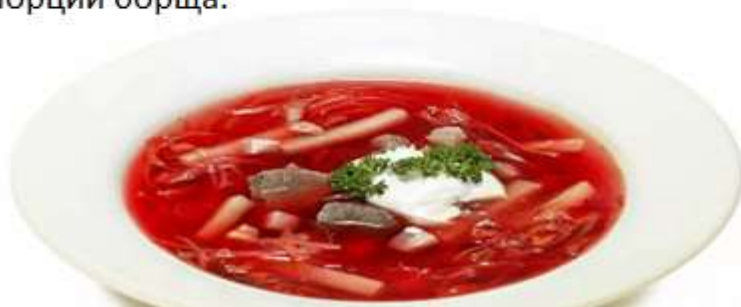
Рисунок 1 – Пример кейс-задания для решения.

20 сентября в ресторане имеются продукты для приготовления борща, в какой последовательности должны идти технологические операции при его приготовлении, какое количество отходов будет при обработке свеклы (г, %) и сколько продуктов весом брутто необходимо для приготовления 5 порций борща.