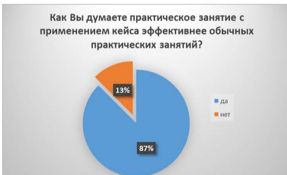
Рисунок 4 – Эффективность занятия с применением кейса

87% опрошенных думает практическое занятие с применением кейса эффективнее обычных практических занятий, остальные 13% с этим не согласились (рисунок 4).