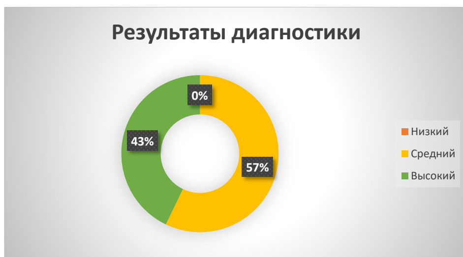
Рис. 2. Уровни сформированности лексико- грамматической стороны речи