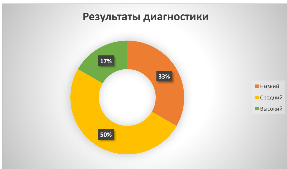
Рис. 1. Уровни сформированности лексико- грамматической стороны речи

Проведя диагностические задания и применив педагогические наблюдения за детьми своей группы, выявила большое количество детей с бедным словарным запасом 4 из 13 человек, а со средним – 7 из 13 (см. рис. 1)