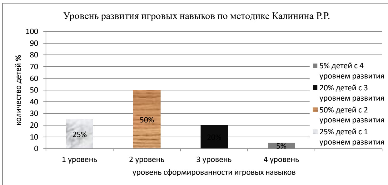
Рисунок 1 – распределение результатов диагностики развития игровых навыков детей старшего дошкольного возраста по методике «Определения уровня развития игровых навыков детей» (Автор Калинина Р.Р.) на констатирующем этапе эксперимента

развития игровых навыков. Результаты исследования уровня развития игровых навыков детей старшего дошкольного возраста с задержкой психического развития в игровой деятельности представлены на рисунке 1.