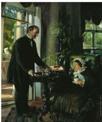
«Помещица», 1886 год; Холст, масло.

Ниже представлены понравившиеся мне репродукции: