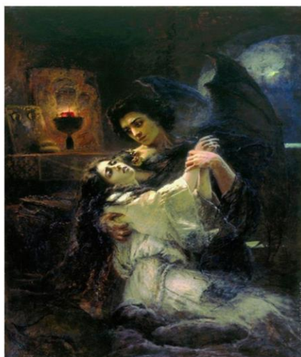
«Демон и Тамара», 1889 год; Холст, масло.