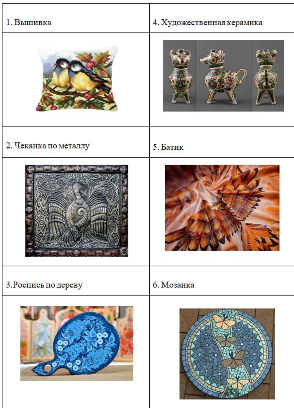
Рисунок 1 - Виды техник декоративно-прикладного искусства