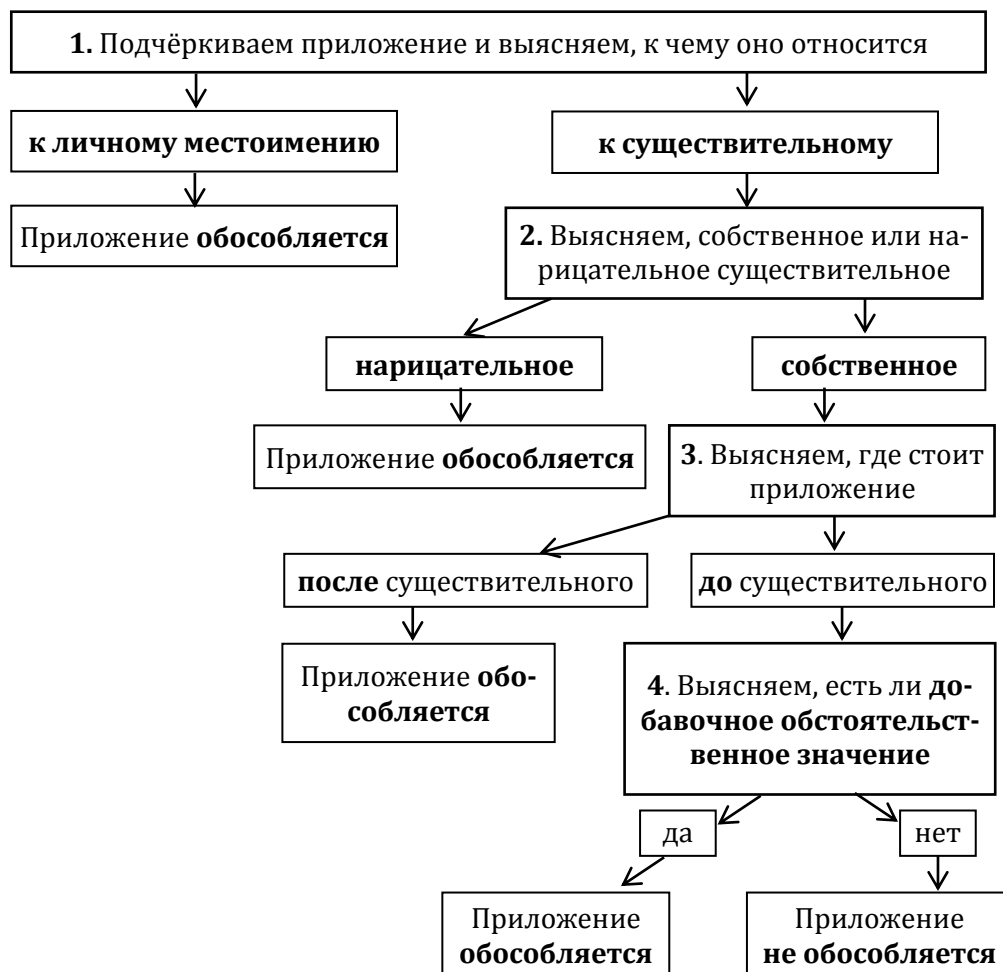
Алгоритм 2. Обособление приложений

Чтобы не допускать пунктуационных ошибок в предложениях с обособленными приложениями, запомните алгоритм и образец рассуждения.