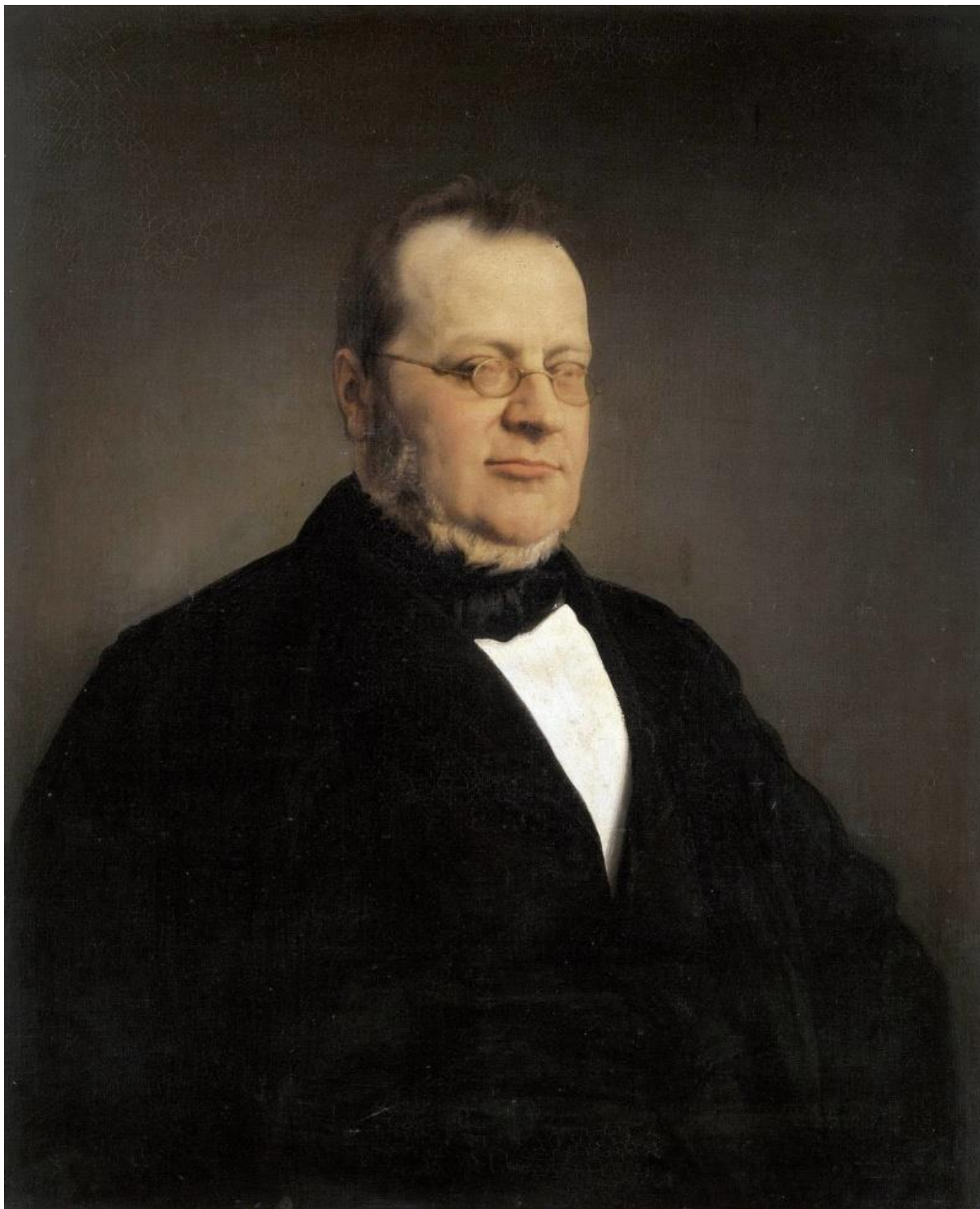
Каммילו Кавур (1810-1861)