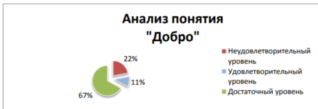
Рисунок 1 – Анализ понятия «добро»

Анализ анкеты «Нравственные понятия» представлен на рисунках 1-5.