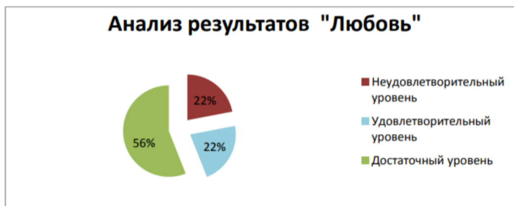
Рисунок 5 – Анализ понятия «любовь»