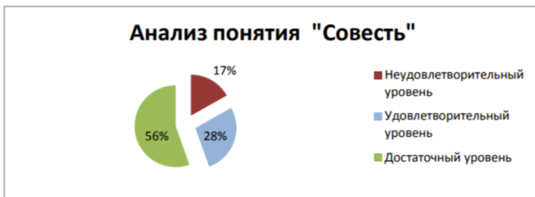
Рисунок 3 – Анализ понятия «совесьть»