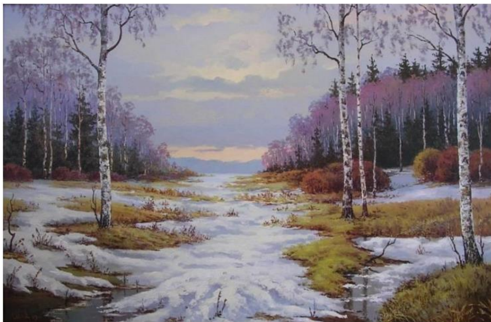
Рисунок 4 – Картина В. Ф. Бракова «Весна на реке Танзаловке»

Определение «звучания» картины (Какие звуки можно услышать в этой картине?) (см. рисунок 4).