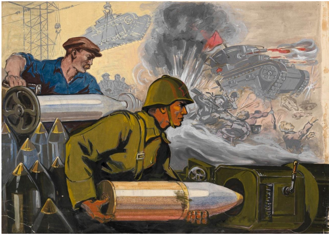
Иллюстрация – «крючок» для определения темы урока