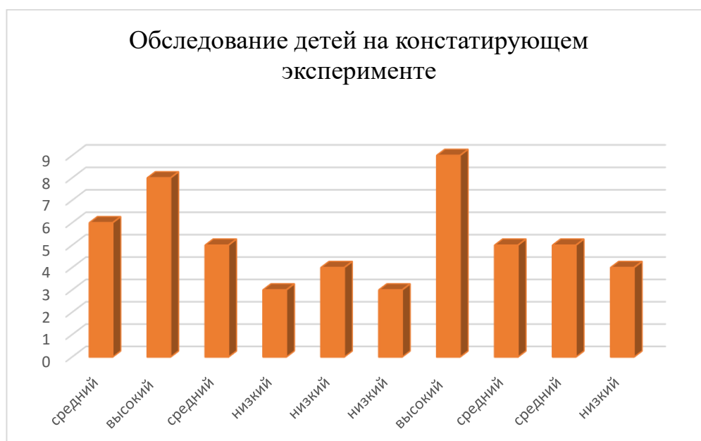
Рисунок №1 – Обследование детей на констатирующем эксперименте

Результаты констатирующего эксперимента были представлены в виде сводной диаграммы.