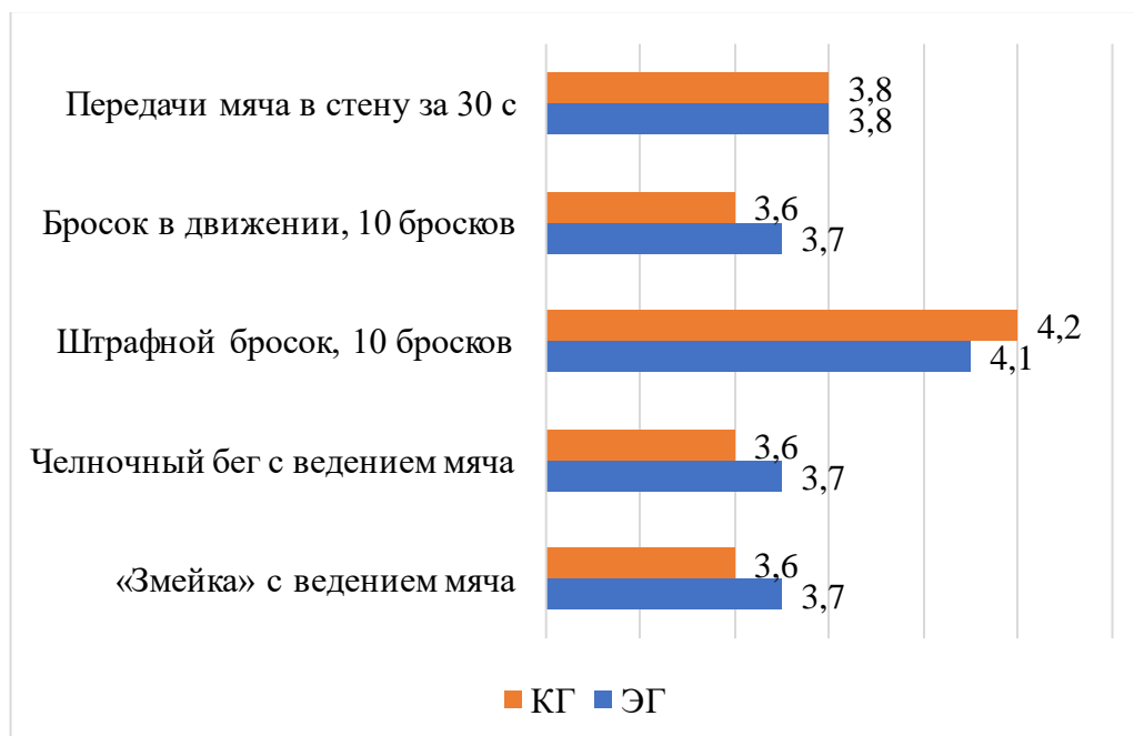
Рисунок 1 – Итоги начального тестирования контрольной и экспериментальной групп

Оценка уровня развития двигательных способностей у юных баскетболистов в процессе учебно-тренировочной работы должна основываться на значимых информационных компонентах структуры их физической подготовленности, а также на регулярном сравнении с ожидаемыми показателями.