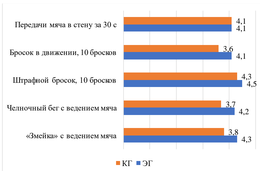
Рисунок 2 – Итоги проверочного теста по физической подготовке учащихся в возрасте 15–16 лет

Мы провели сравнительный анализ среднего балла физической подготовленности в каждой из экспериментальных групп до и после проведения педагогического эксперимента. Итоги приведены в таблице 8.