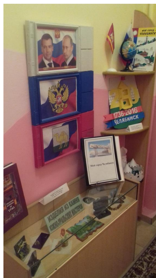
Патриотический уголок МАДОУ «ДС №364 г. Челябинска»