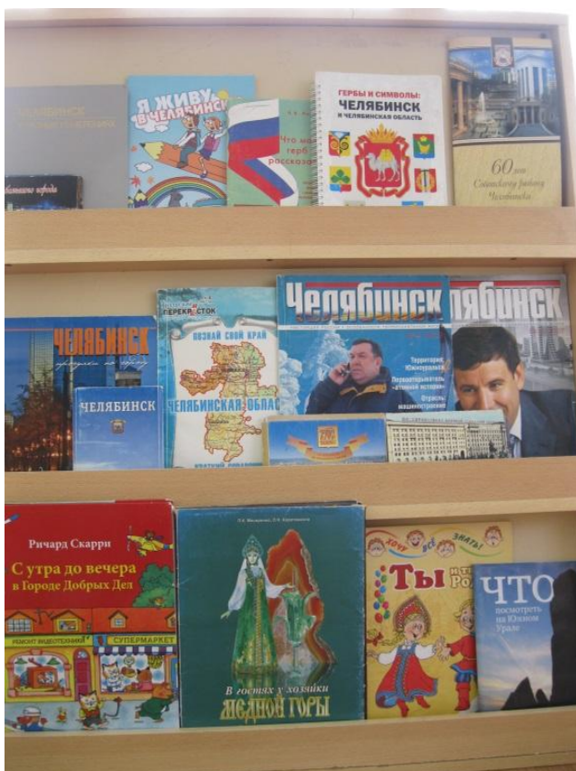
Библиотека группы №5