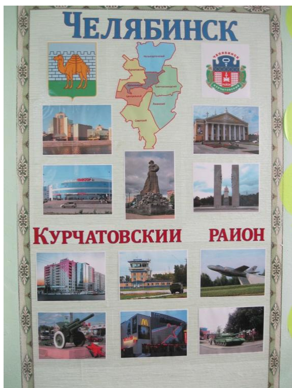
Уголок «Мой город Челябинск»