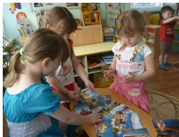
Использование фотографий достопримечательностей города в РППС