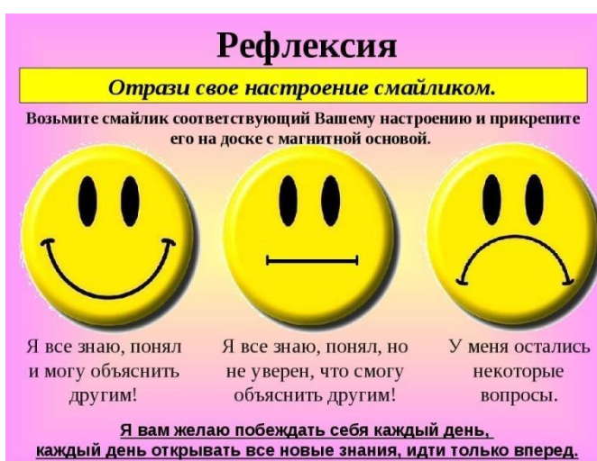
Рис.2. Рефлексия эмоционального состояния и настроения. Проводится в конце урока.

Рефлексия «Отрази свое настроение смайликом»