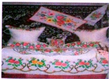
Рис.1 Вышивка крестом.

Основные виды, используемые в технике декорирования изделий: