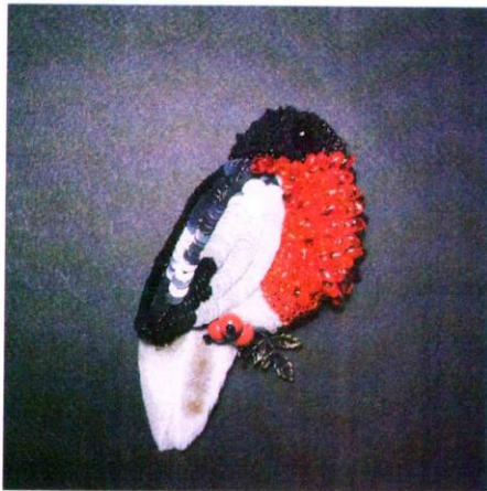
Рис. 26 Брошь - снигирь.