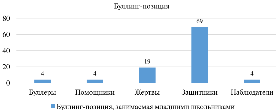
Рисунок 1 – Буллинг-позиция, занимаемая младшими школьниками (%)

Проанализировав результаты обучающихся 2 «А» класса, представим их на рисунке 1: