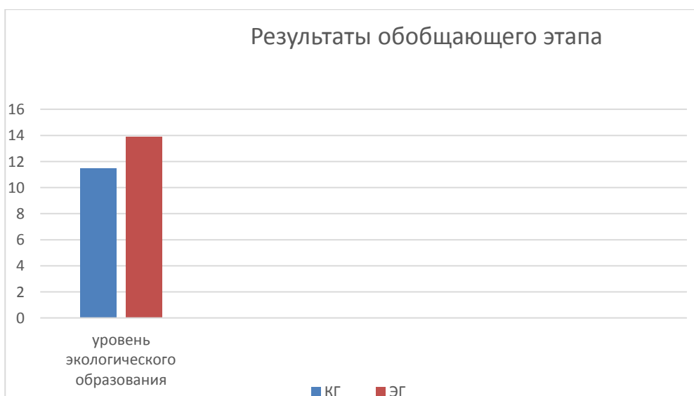
Рисунок 2 – Результаты обобщающего этапа эксперимента

Как мы видим на обобщающем этапе в экспериментальных группах динамика роста показателей выше, чем на начало эксперимента. Показатели экспериментальной группы 2, где обучение проводилось с применением метода проектов, выше показателей экспериментальной группы 1. Это доказывает, что применение метода проектов при обучении иностранному языку способствует эффективному формированию экологического образования.