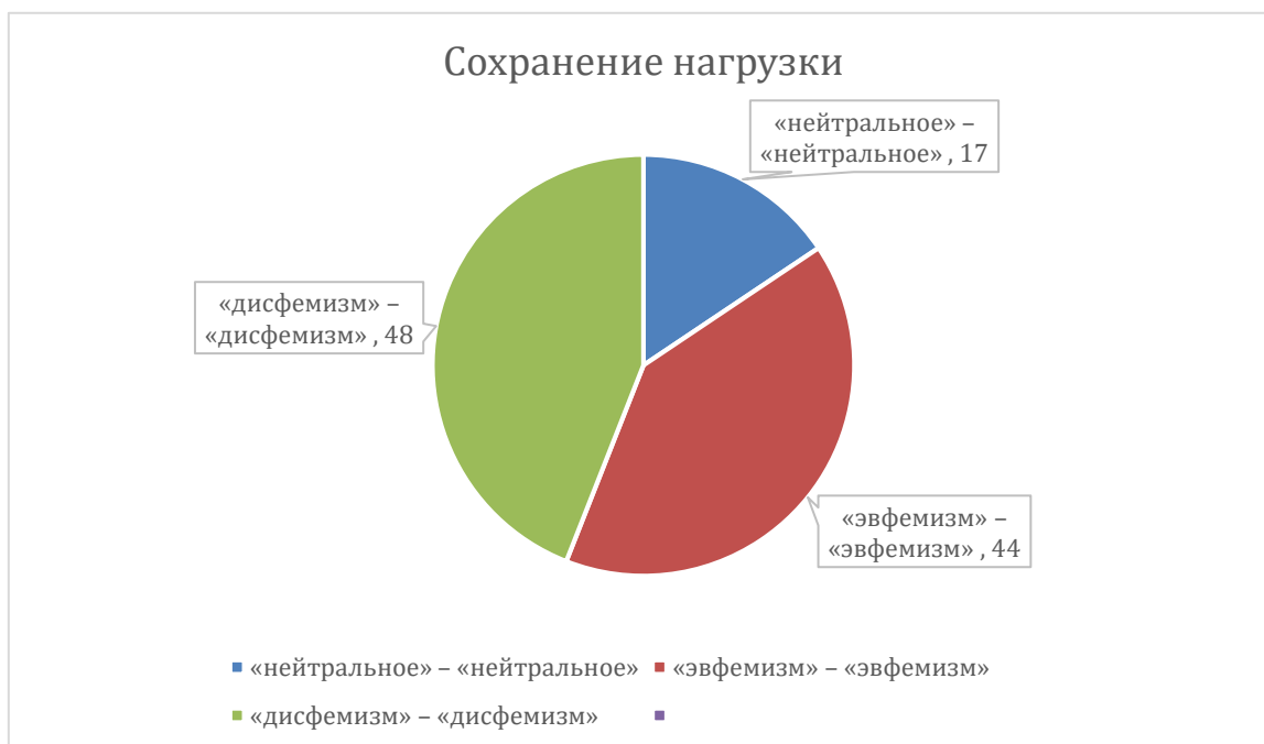
Рисунок 1 – Сохранение аксиологической нагрузки при переводе эвфемизмов и дисфемизмов с английского на русский язык.

По результатам проведенного нами переводческого анализа была составлена статистика переводческих трансформаций, использованных при переводе эвфемизмов и дисфемизмов. Статистические данные по проведённому исследованию можно видеть на рисунке 1.