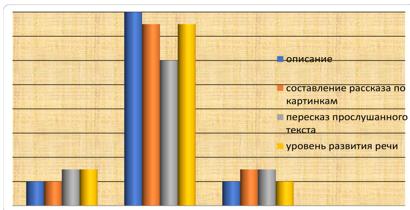
Рис.1.- Исследование связной речи детей старшего дошкольного возраста в контрольной группе.

Во время изучения связанной речи у детей экспериментальной группы мы обнаружили следующие данные и зафиксировали их в таблице 2 и на рисунке 2.