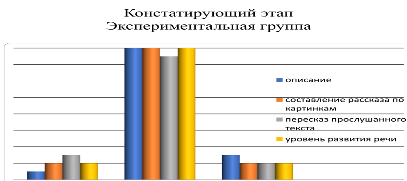
Рис.2.- Исследование связной речи детей старшего дошкольного возраста в экспериментальной группе

Высокий уровень развития речи показали двое детей, их рассказы были информативными, выразительными, грамматически правильными, что составляло 10%.