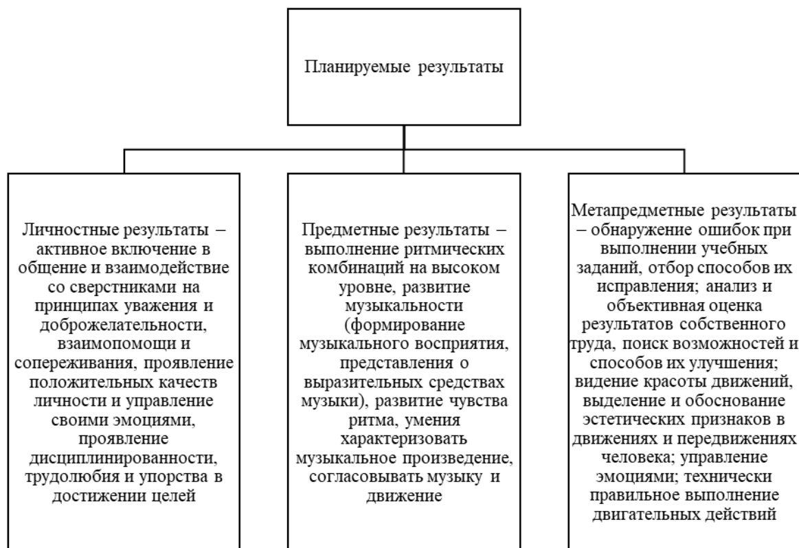
Рисунок 2 – Планируемые результаты программы «Ритмика и танец»

Планируемые результаты программы «Ритмика и танец» представлены на рисунке 2.