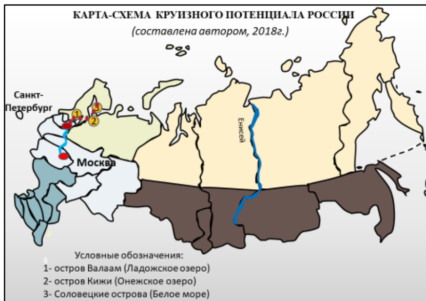
Рис. 5 Карта-схема круизного потенциала России (составлено автором, 2018 г.)

Необходимость более динамичного развития круизного туризма в РФ ни у кого не вызывает сомнения. Страна для этого обладает всеми уникальными возможностями: она омывается водами двух океанов и четырёх морей и имеет самую протяжённую береговую линию в мире 37 653 км (рис.5).