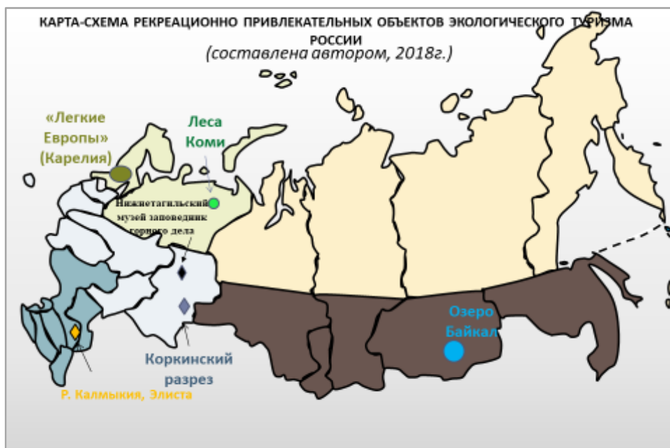
Рис. 3 Карта-схема рекреационно-привлекательных объектов экологического туризма России (составлено автором, 2018 г.)

преобразованными антропогенной деятельностью человека. Таких мест в России довольно много. В этом отношении наиболее привлекательна территория Уральского региона, основу развития которого составила горнодобывающая промышленность и в наследство современному поколению остались объекты промышленного значения. Например, «Коркинский угольный разрез» – это гигантская яма, глубиной более 500 метров, и диаметром около 3,5 километров. Это самый глубокий угольный разрез в Евразии, и единственный в мире карьер, где добывают уголь с глубины более 500 метров открытым способом. Ежегодно сюда приезжают сотни человек не только из России, но и из других стран, чтобы посмотреть на это чудо света. Ещё одним примером мест, преобразованных антропогенной деятельностью, является Людмилинская скважина г. Соликамск – является достопримечательностью города. Республика Калмыкия район Элиста с опустыниванием территории также является местом преобразованным деятельностью человека, Нижнетагильский музей заповедник горного дела, Андреевский каменный карьер г. Пласт, как рукотворный памятник горного дела и др. Посещение таких мест растёт с каждым годом (рис.3).