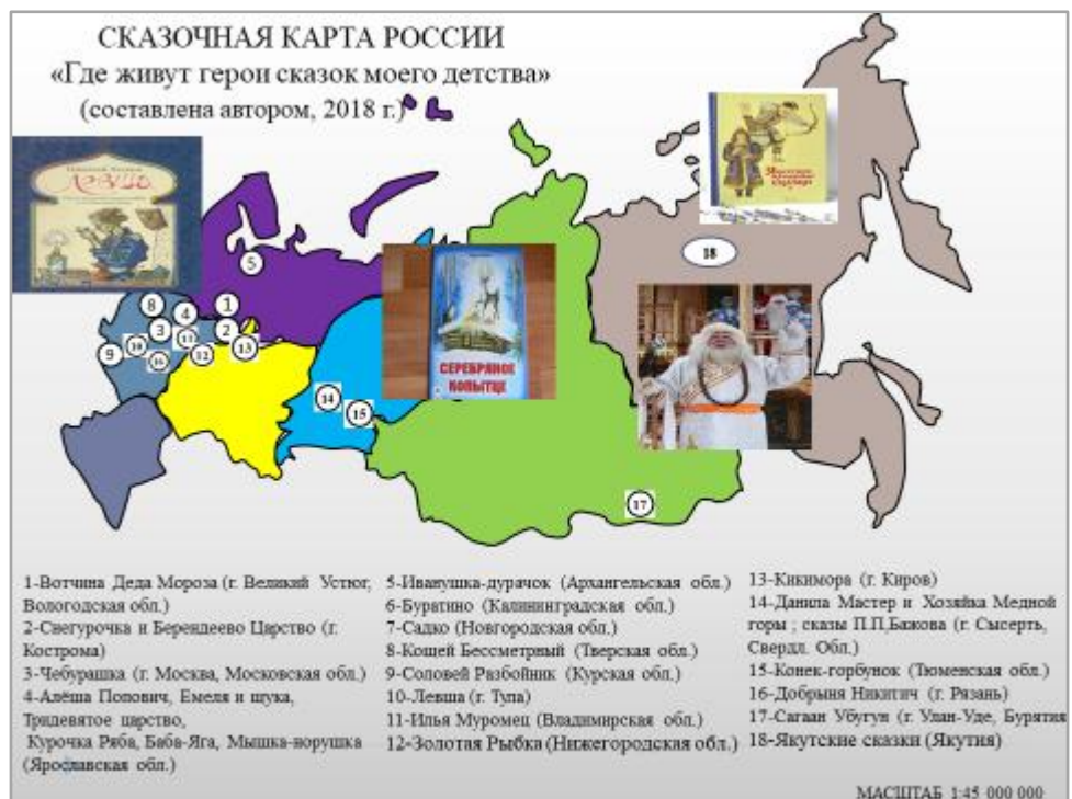
Рис. 4 Сказочная карта России «Где живут герои сказок моего детства» (составлено автором, 2018 г.)

Сегодня на Сказочную карту уже нанесено десятков местоположений объектов туризма, и с каждым днём появление новых персонажей сказок народов многонациональной России является перспективным. Например, знаменитые сказы П.П. Бажова: «Серебряное копытце» г. Пласт, Бурятские и Якутские народные сказки (рис.4).