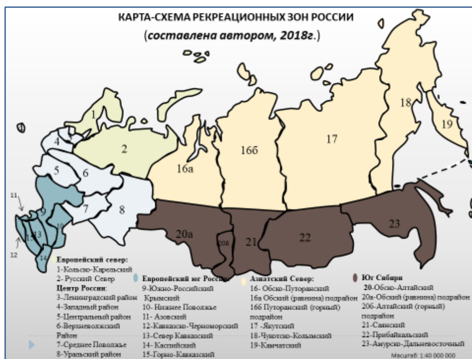
Рис. 1 Карта-схема рекреационных зон России (составлено автором по материалам сайта, 2018 г.)

Схема рекреационного районирования была разработана Российской академией туризма в 1996г., в которой выделялось 5 рекреационных зон (рис.1).