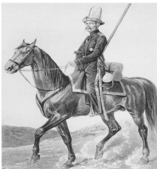
«Казак башкирских кантонов. 1829–1838». Историческое описание одежды и вооружения российских войск, под ред. Висковатова А.В., Часть 27. – СПб.: Воен. тип., 1841–1862

Подтверждение выше сказанному мы находим у Александра Васильевича Висковатова (22.04.1804 – 27.02.1858 г.) – российского военного историка; генерал-майора, художника-иллюстратора. В первом томе книги «Историческое описание одежды и вооружения Российских войск» изображена одежда уральских казаков башкирских кантонов (кантон – населенный пункт).