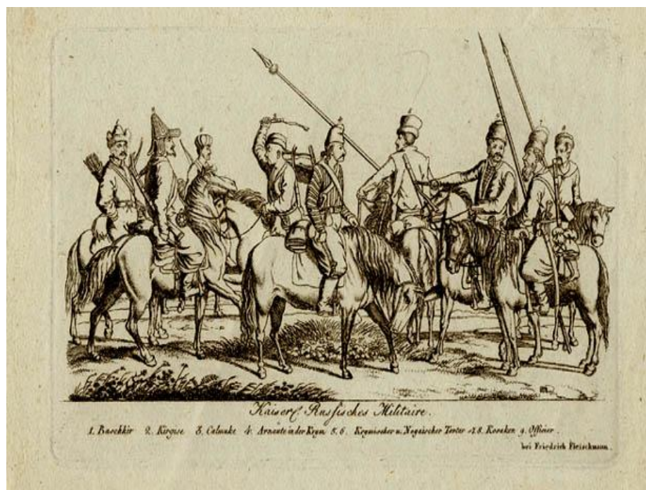
Гравюра. Денис Давыдов и башкирские конники

Наши воины всегда умели сражаться за независимость своего Отечества. И наши земляки – не исключение. В начале Отечественной войны 1812 года народ Российской державы получил благословение Церкви, на сопротивление врагу, во всех храмах и мечетях служились молебны о победе. В этой войне принимали участие уральские казаки (русские, башкиры, типтяре, татары, нагайбаки и др.), некоторые состояли в личном конвое фельдмаршала Михаила Илларионовича Кутузова. В качестве добровольцев в Бородинском сражении на важнейшем участке битвы выступил батальон, основная часть которого состояла из жителей Челябинска и области. О славных победах, совершенных казаками нашего края при освобождении городов Европы от наполеоновской армии, напоминают названия населенных пунктов Челябинской области – Берлин, Париж, Варна, Бреды, Фершампенуаз. Вот почему так важно знать историю своей малой родины, своего родного края.