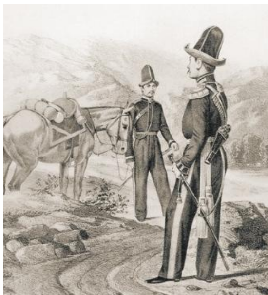
Урядник и штаб-офицер Башкирских кантонов, 1838–1845. Литография

Свою верность и храбрость мусульманские народы не раз доказывали честной службой в российской армии в мирное время и во время многочисленных войн за независимость страны.