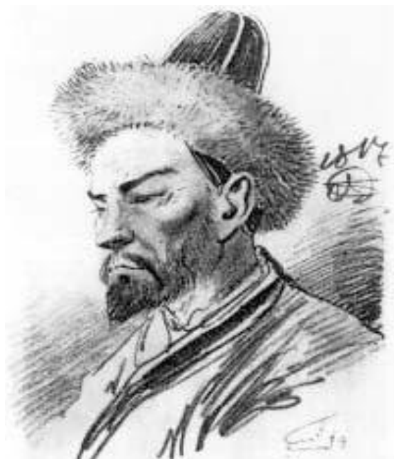
Голова башкира. Орловский А. О. 1817 г. (Национальный музей, Варшава)

в 1817 г. – «Всадник-башкир» (Государственная Третьяковская галерея) и «Голова башкира» (Национальный музей, Варшава); в 1823 г. «Всадник-башкир» (Башкирский республиканский художественный музей им. Нестерова, г. Уфа).