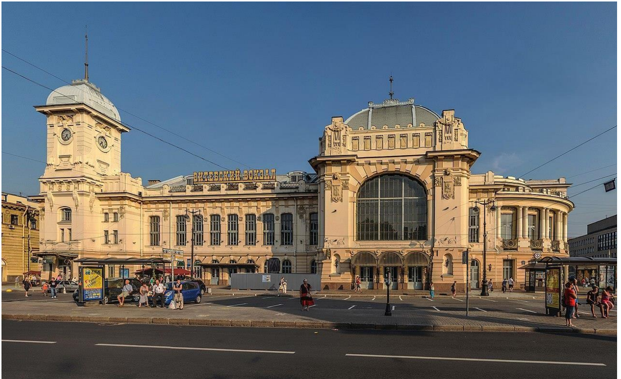
Рисунок 3 – Витебский вокзал, 1904.