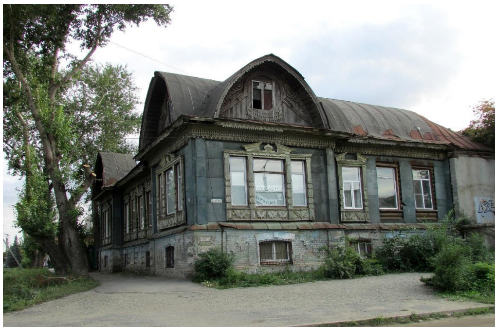
Рисунок 16 – Дом Степанова, г. Троицк, 1911.