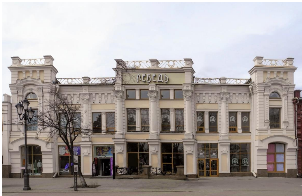
Рисунок 4 – Магазин Валеева, 1911, А. А. Федоров.