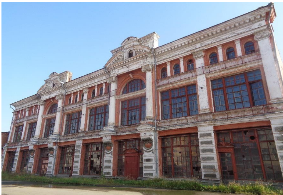
Рисунок 13 – Здание пассажа Яушевых, г. Троицк, 1911, А.А. Федоров.