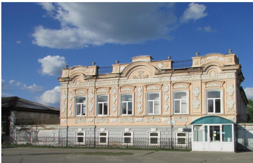
Рисунок 15 – Жилой дом (Дом Латифа Шариповича Яушева), г. Троицк, 1880-е. Источник: Общественный фонд Южный Урал [8]