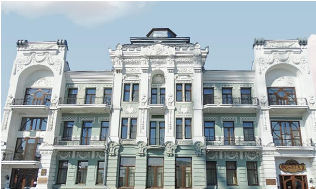
Рисунок 12 – Здание гостиницы Башкирова, г. Троицк, 1909, А.А. Федоров.