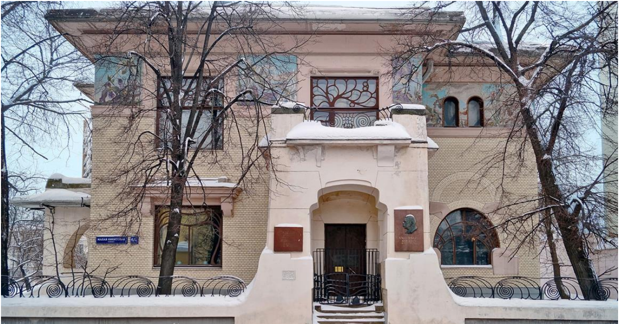
Рисунок 1 – Особняк С. П. Рябушинского на Малой Никитской, 1900-1903.

Источник: Государственный музей архитектуры им. А. В. Щусева [14]