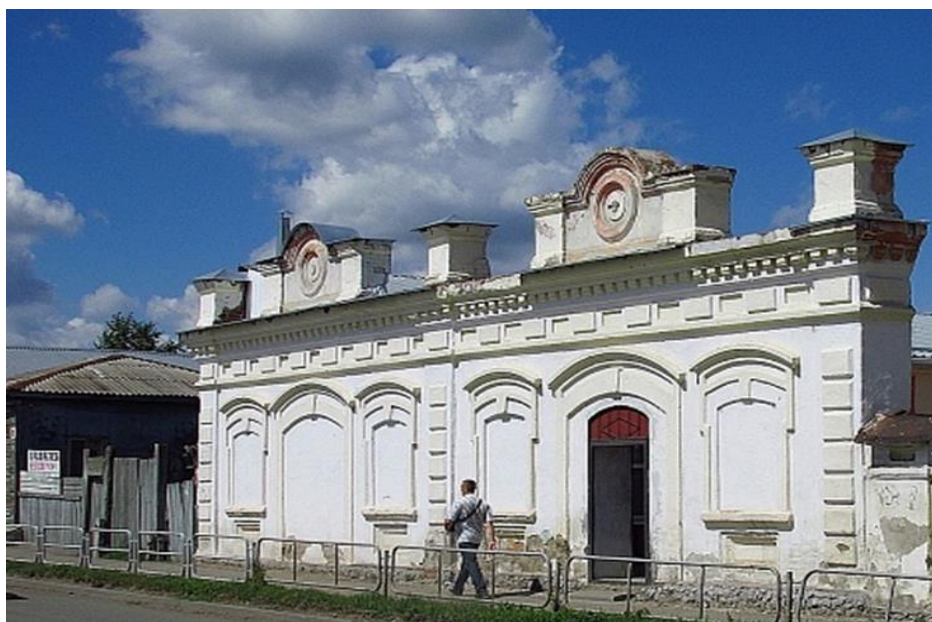
Рисунок 14 – Торговый корпус, г. Троицк, начало XX века.