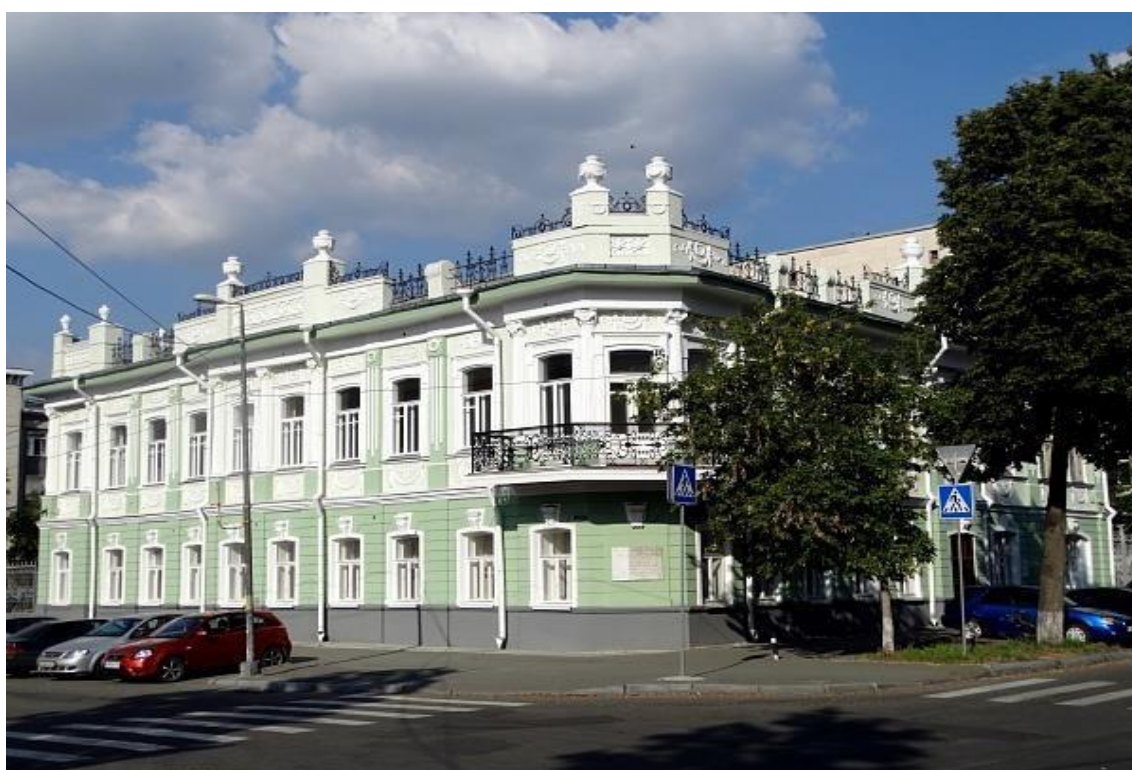
Рисунок 6 – Особняк Архипова, 1911, А. А. Федоров. Источник: Общественный фонд Южный Урал [8]