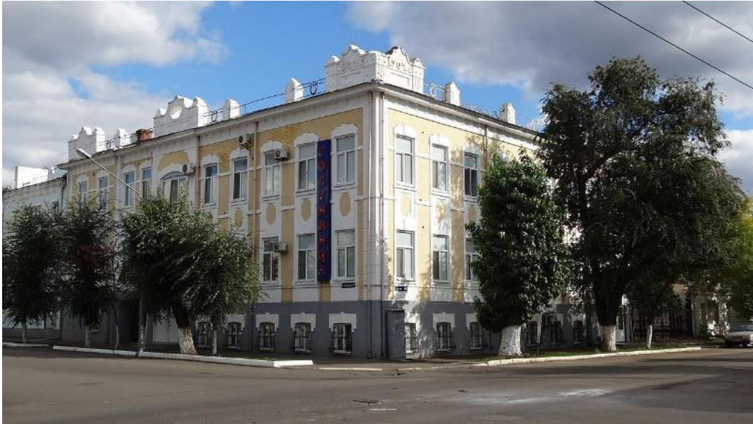
Рисунок 11 – Здание гостиницы Бристоль, г. Оренбург, 1907. Источник: Общественный фонд Южный Урал [8]