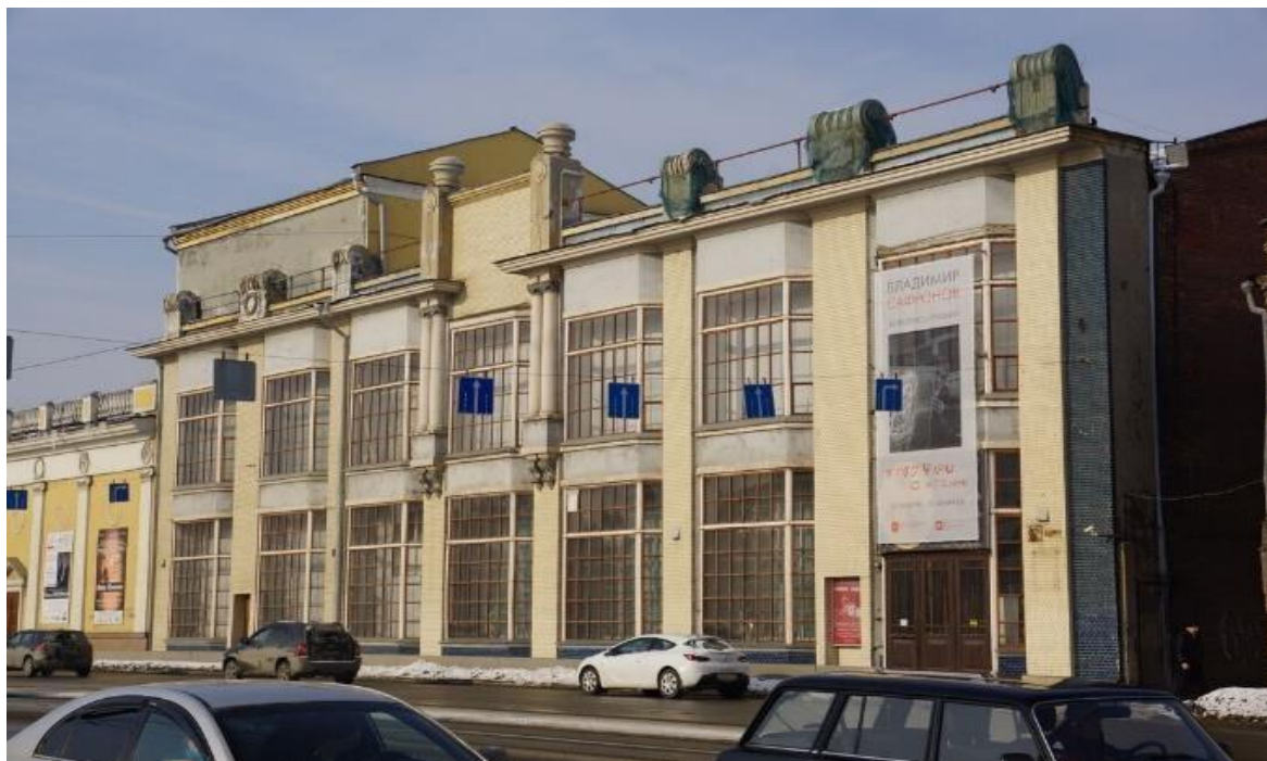
Рисунок 5 – Здание Пассажа Яушевых, 1913, А.А. Федоров. Источник: Общественный фонд Южный Урал [8]