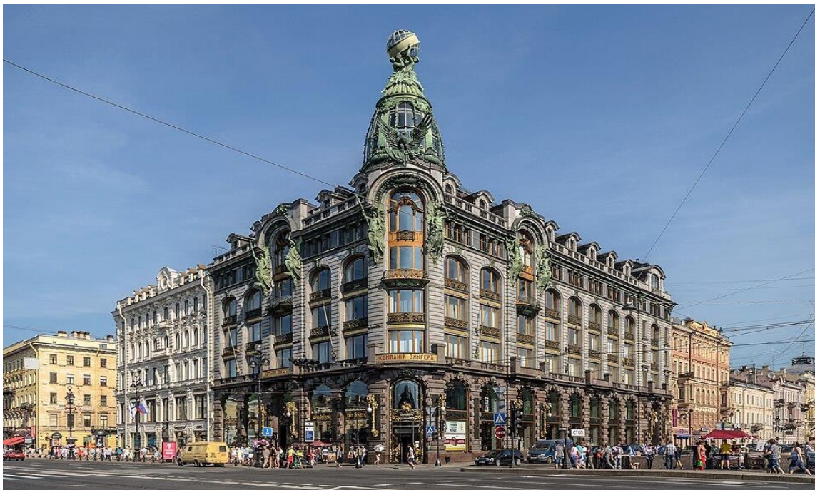
Рисунок 2 – Дом компании «Зингер», 1902-1904.

Государственный музей архитектуры им. А. В. Щусева [14]