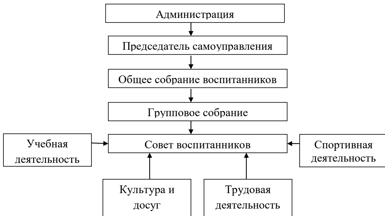
Рисунок 2 – Модель самоуправления воспитанников детского дома

Высшим органом самоуправления выступает общее собрание воспитанников, на котором подводятся итоги главных дел года уходящего и определяются дальнейшие перспективы предстоящего года, корректируется структура органов детского самоуправления. Принятые решения общего собрания обязательны для выполнения всеми воспитанниками.