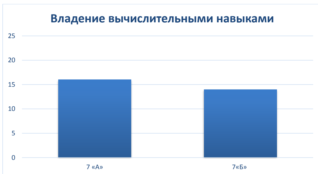
Рисунок 2 – Результаты уровня владения вычислительными навыками обучающимися после проведенных уроков.

На рисунке 2 наглядно представлен уровень владения вычислительными навыками в 7«А» и 7«Б» классах на основе анализа контрольной работы №4 «Степень и её свойства. Одночлены». В 7«А» классе 16 обучающихся выполнили задания без вычислительных ошибок, а в другом классе 14 обучающихся.