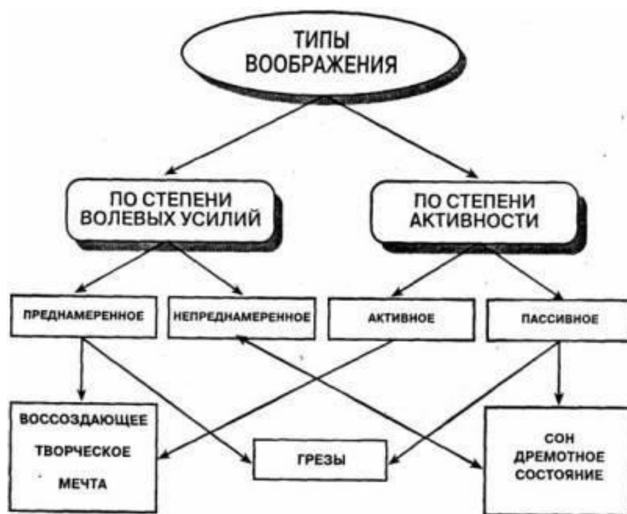
Рисунок 1 – Типы воображения

В чем состоят особенности развивающегося воображения у ребенка?