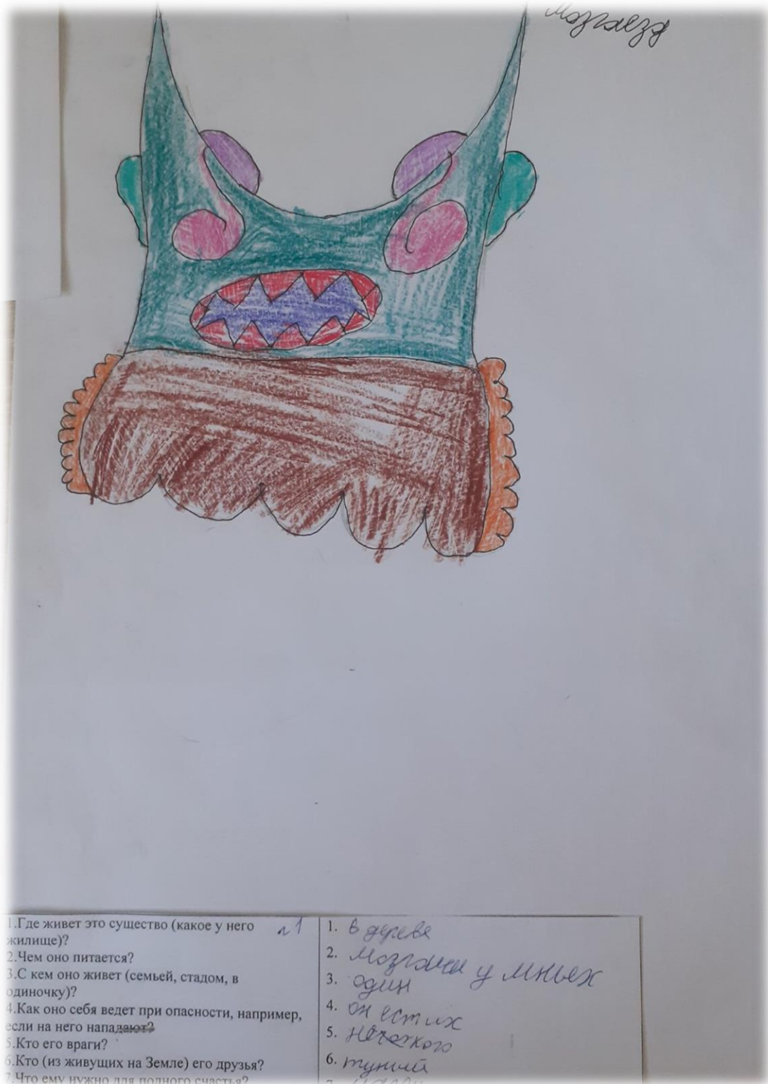
Рисунок А.1 – «Несуществующее животное». Пример высокого уровня тревожности

Рисунки учеников 3 класса по методике «Несуществующее животное»