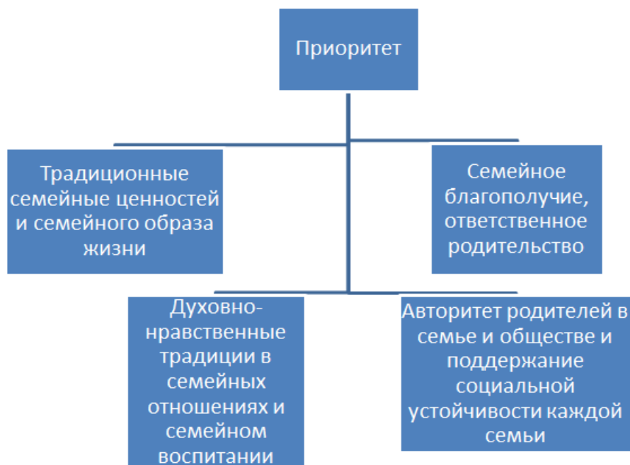
Рисунок. 2 – Концепция государственной семейной политики в РФ на период до 2025 г. (Распоряжение Правительства РФ от 25 августа 2014 г. N 1618-р)