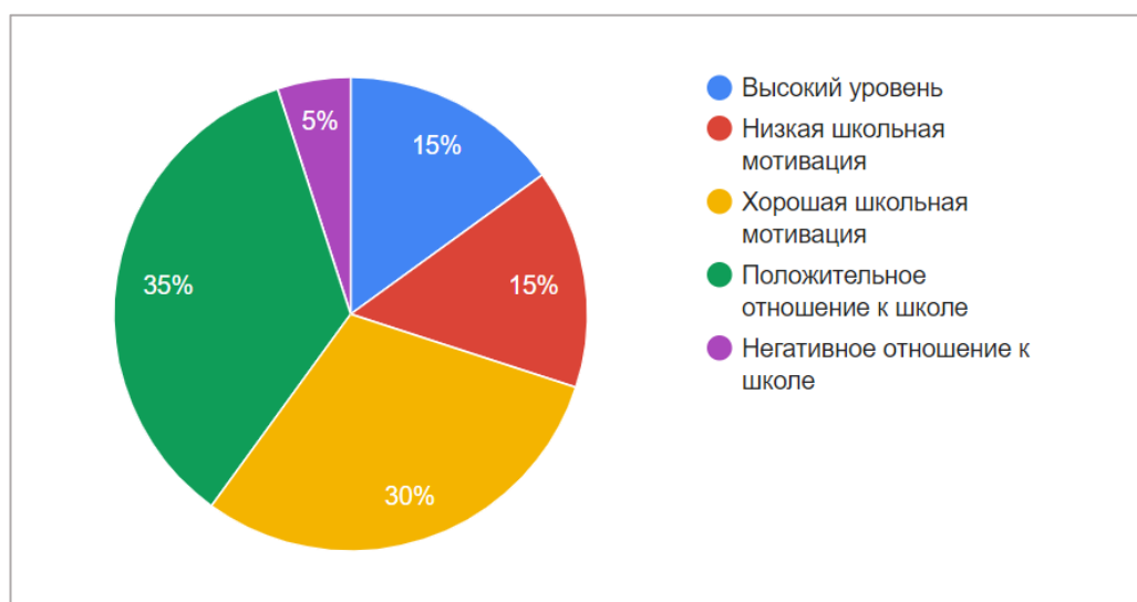
Рисунок 1 – Результаты уровня школьной мотивации у младших школьников

С помощью анкетирования мы определили уровень школьной мотивации у младших школьников данного класса. Узнали отношение детей к школе и учебному процессу, а также выявили их эмоциональную реакцию на школьную среду, с помощью диагностики: «Диагностика уровня школьной мотивации младших школьников», автор Н. Г. Лусканова. Полученные результаты представлены на рисунке 1.