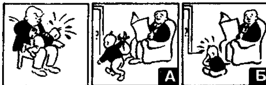
Рис. 1. Ситуации из теста социального интеллекта Дж. Гилфорда

Например, в тесте социального интеллекта Дж. Гилфорда (рис. 1) в качестве продолжения ситуации 1 американцы, в основном, выбирают вариант А, а россияне – вариант Б. Именно эти ответы являются типичными, «правильными» для этих культур.