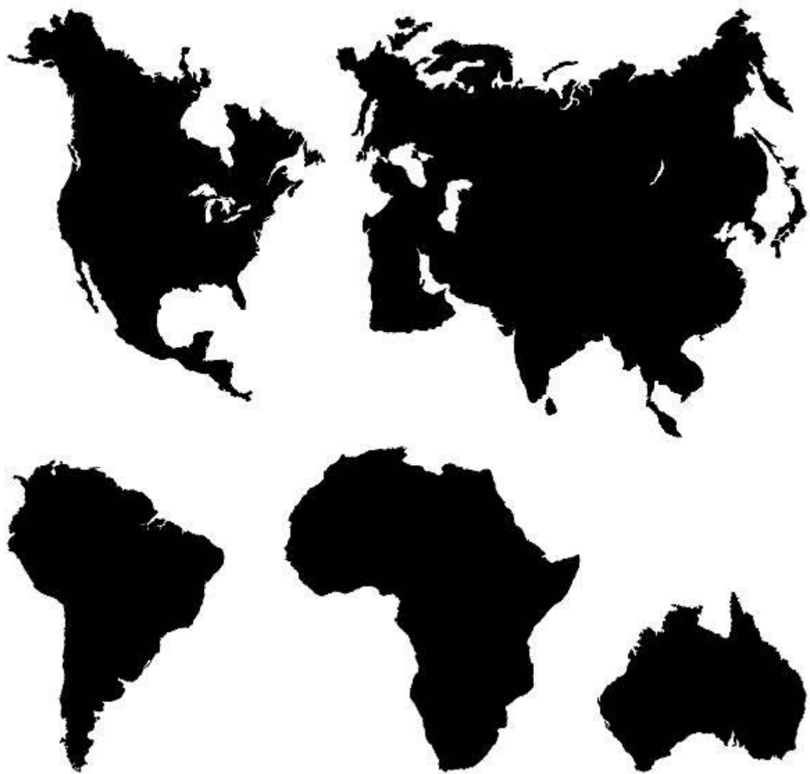
Рисунок 2-Силуэты материков

Так же можно делить задания на уровни сложности, подбирая силуэты, которые труднее узнать.