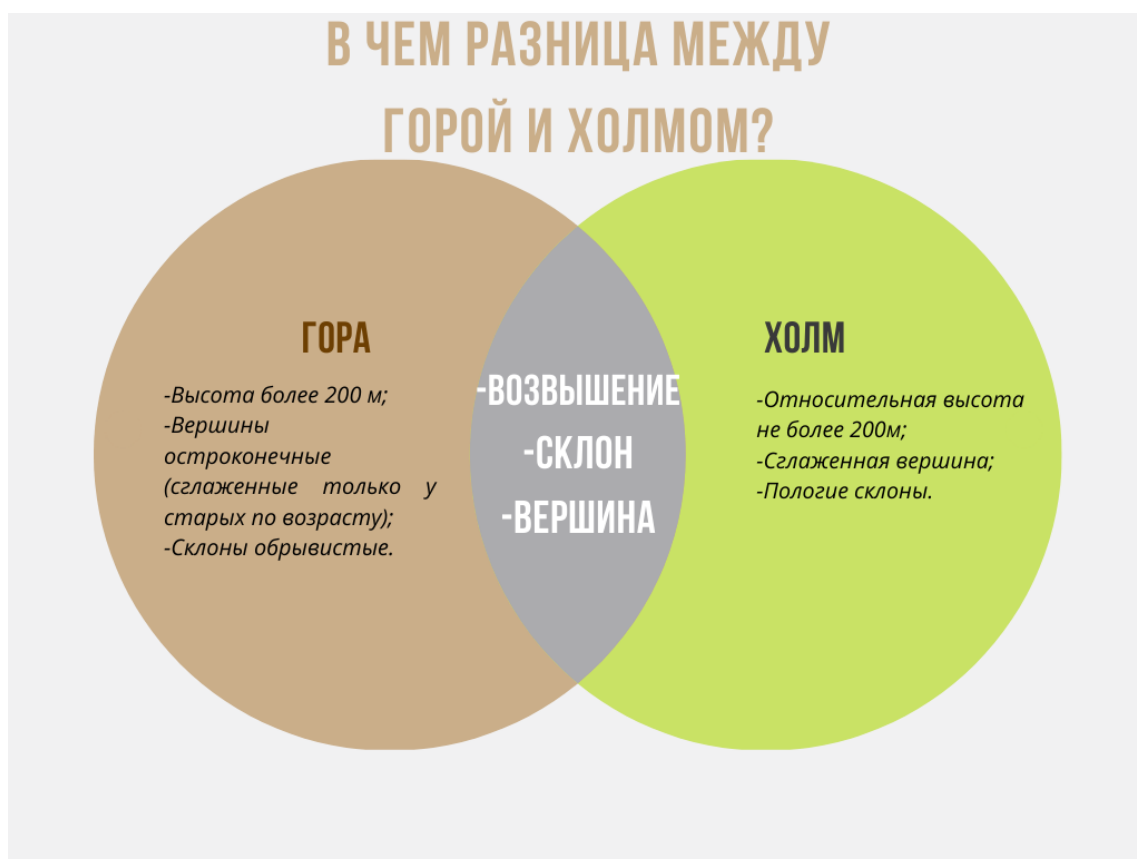
Рисунок 5-различие между горой и холмом, отраженные в диаграмме Венна