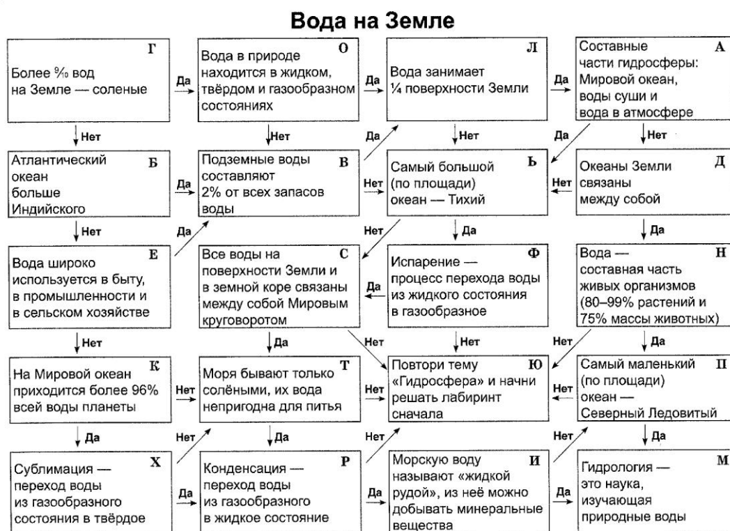
Рисунок 1-«Географический лабиринт»