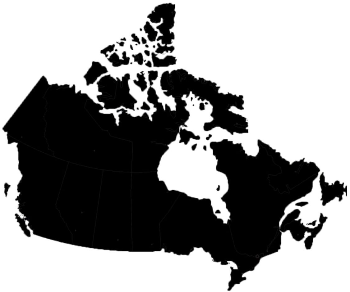
Рисунок 4- силуэт Канады