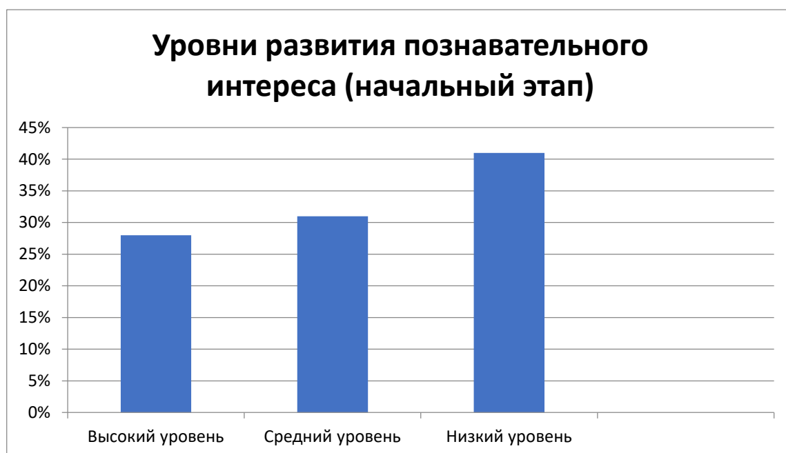
Рисунок 6 - Уровни познавательного интереса на начальном этапе

Как уже было сказано выше, существует 3 уровня развития познавательного интереса: высокий, средний и низкий уровни. На примере данной классификации, в 7 «СЭ» классе мы получаем следующее (Рисунок 6):