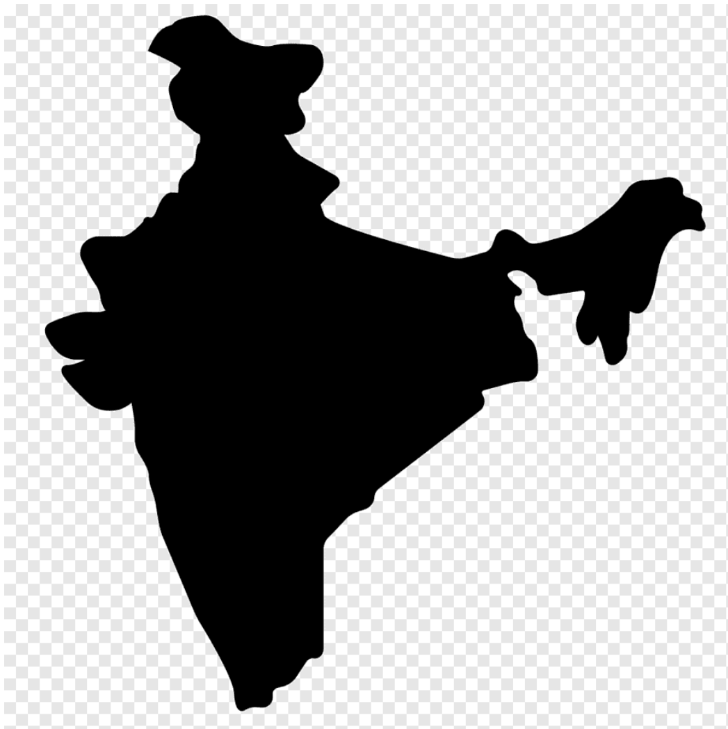
Рисунок 3- силуэт Индии