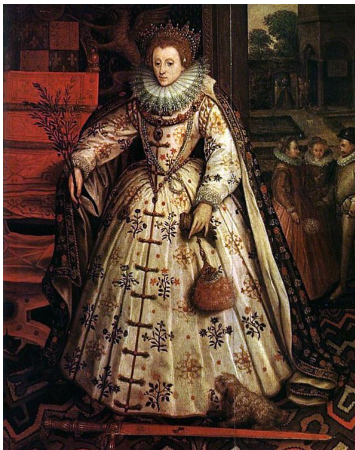
Рис. 3. Портрет мира (1580, Маркус Герартс)