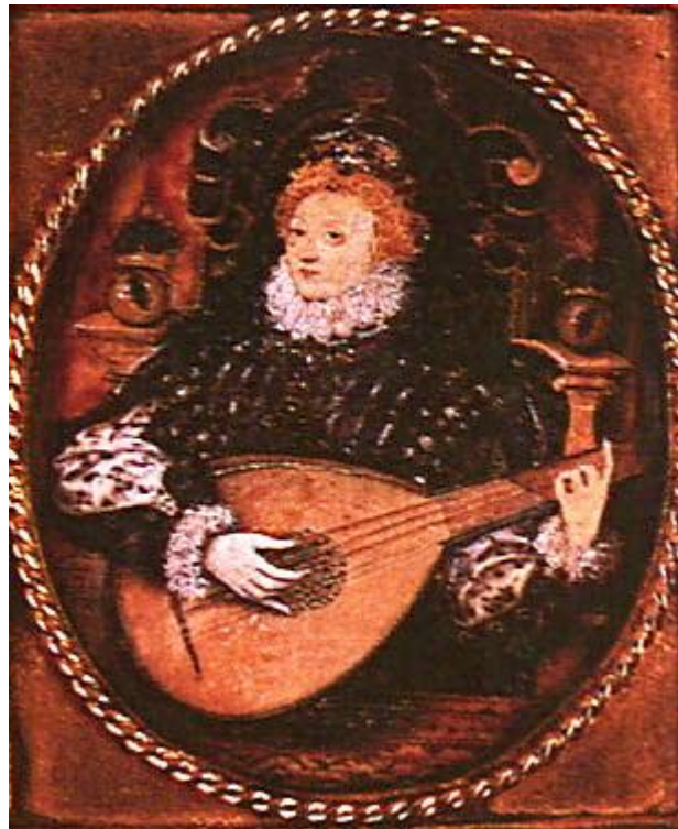
Рис. 2. «Елизавета, играющая на лютне» (Хиллиард, дата неизв.)