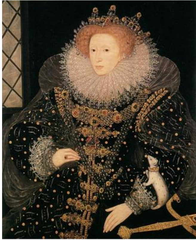
Рис. 5. Портрет с горностаем (1585, Хиллиард)