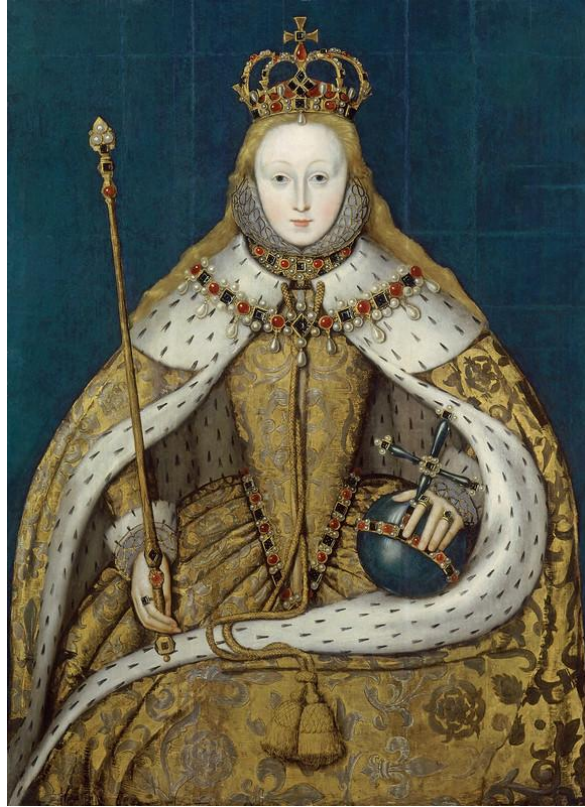
Рис. 1. Коронационный портрет (прим. 1600, неизв. худ.)