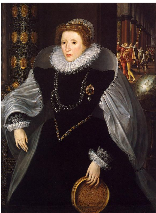
Рис. 4. Портрет с ситом, он же Сиенский (1583, Квентин Метсис)