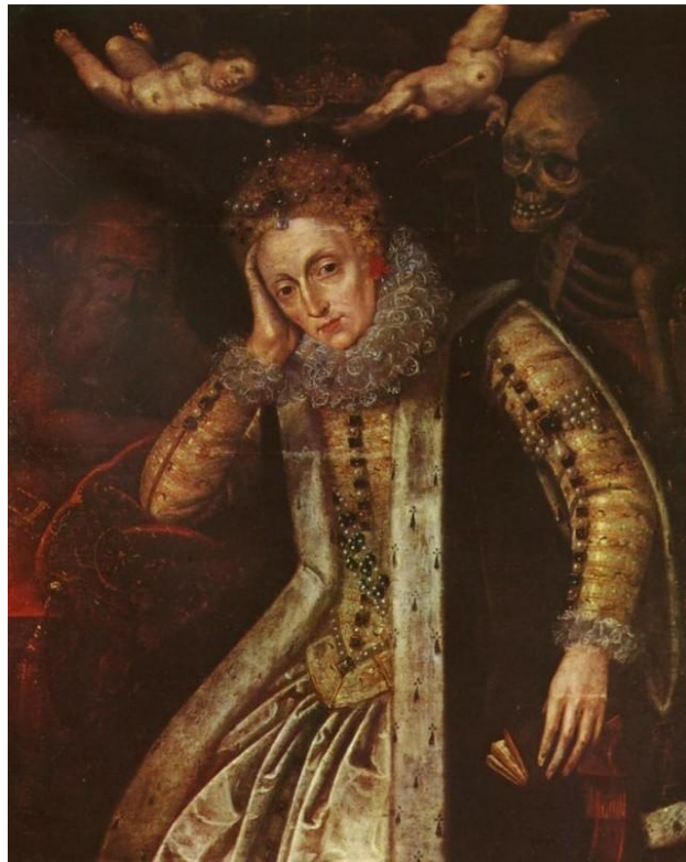
Рис. 6. Портрет с Армадой (1588, неизв. худ.)