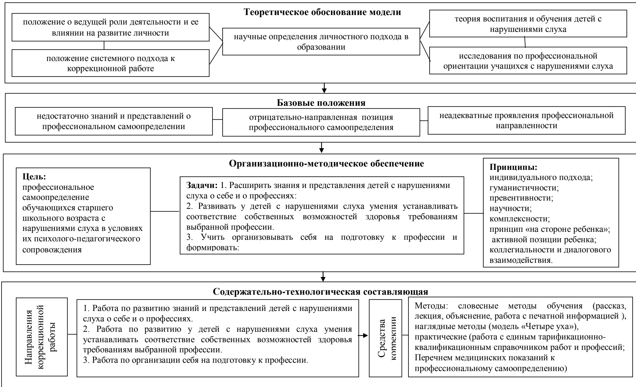
Рисунок 2 – Модель психолого-педагогического сопровождения профессионального самоопределения обучающихся старшего школьного возраста с нарушениями слуха