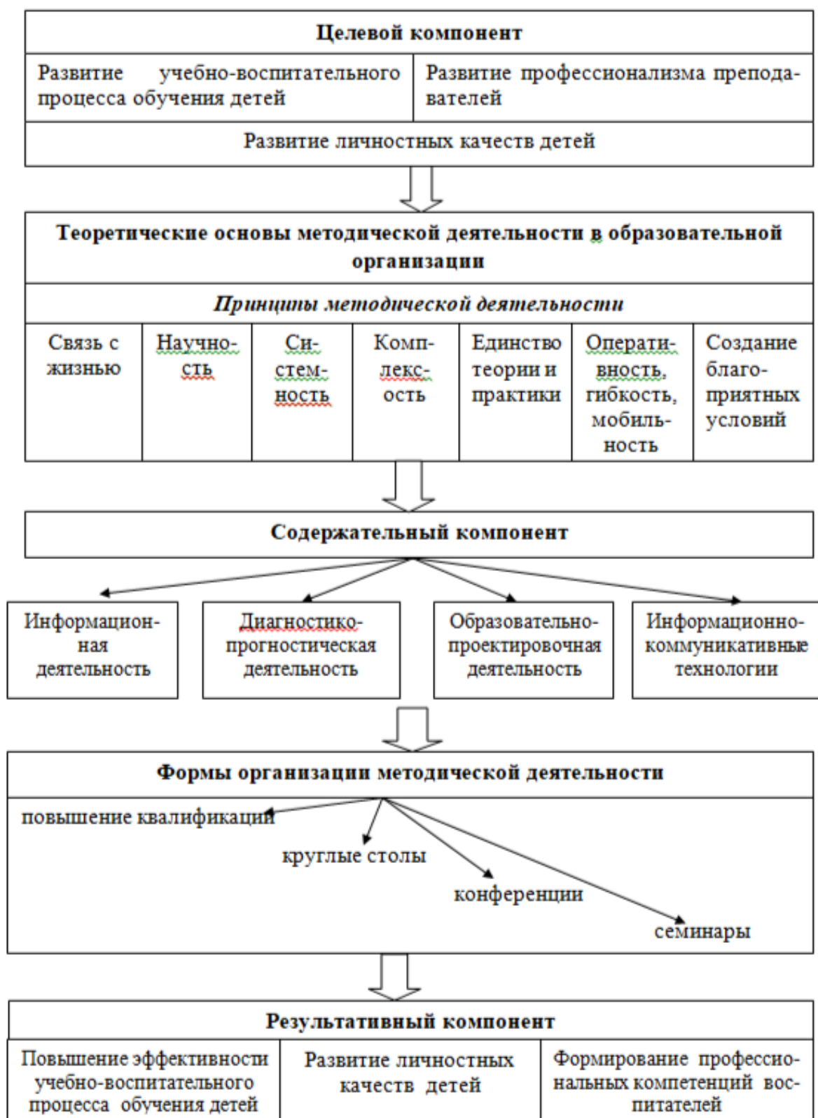
Рисунок 1 - Модель методической деятельности в образовательной организации