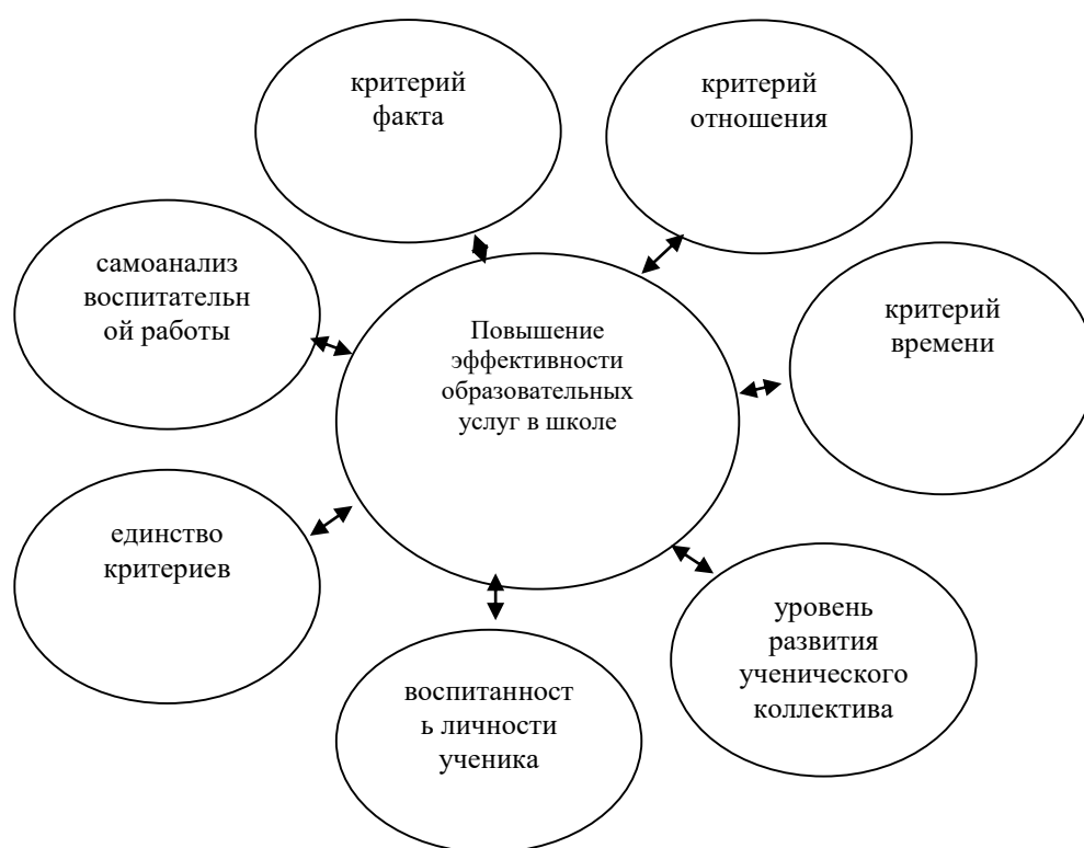
Рис. 2. Критерии эффективности образовательных услуг, которые необходимо учесть при реализации предлагаемых мероприятий.

В ходе всех проверок внимание должно сосредотачиваться не только на выявлении недостатков, но и на анализе положительного опыта.