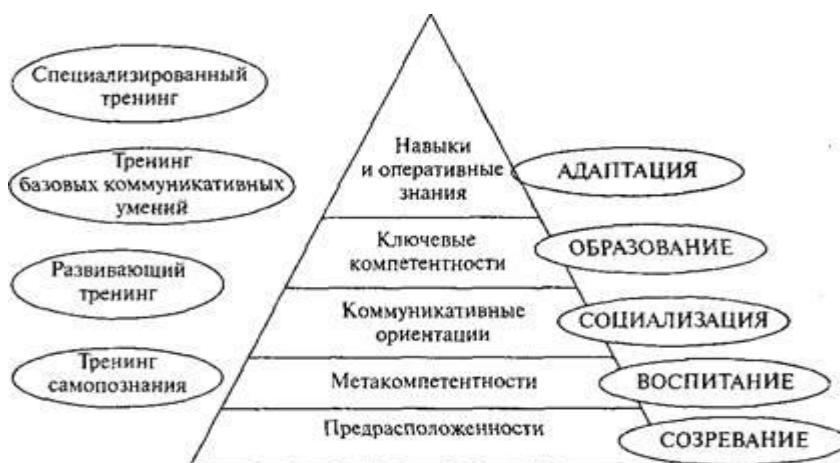
Рис. 2. Место коммуникативного тренинга в системе формирования и развития коммуникативной компетентности