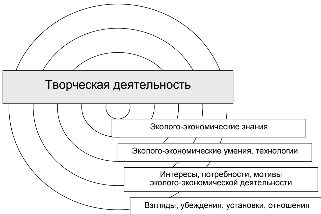
Рис. 3. Модель готовности учителя к осуществлению эколого-экономического образования (по Н.П. Рябининой)

На основе концепций структуры личности (М.С. Каган, К.К. Платонов) разработана структура готовности учителя к эколого-экономическому образованию, которая отражена в модели (рис. 3).