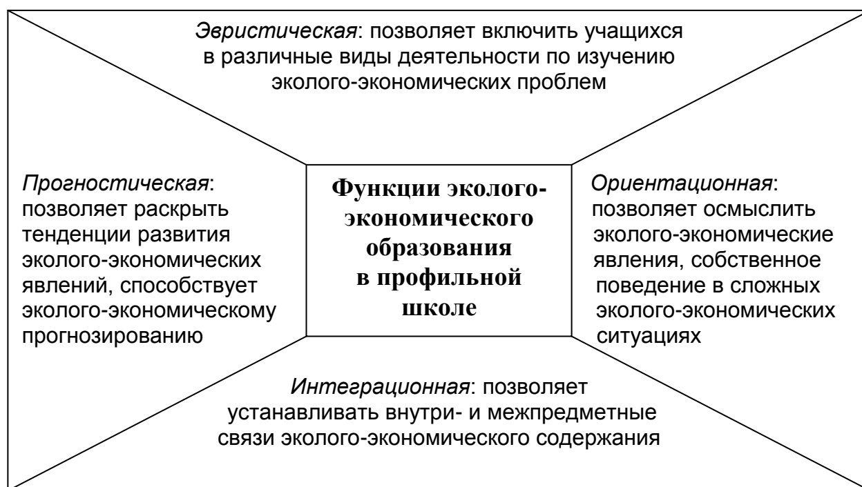
Рис. 2. Функции эколого-экономического образования в профильной школе

Взаимосвязь представленных компонентов эколого-экономического образования в профильной школе просматривается на функциональном уровне (рис. 2).