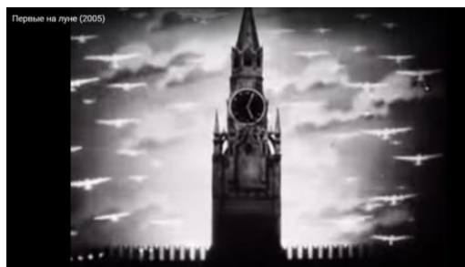
Рис. 3 (URL:

ганда возвращается к визуальной риторике незыблемой и вечной власти государства.