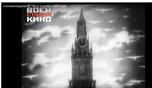
Рис. 2 (URL:

Этот образ использовался и в последующих выпусках «Союзкиножурнала», но подвергся значительным изменениям в первые годы войны — например, см.: Союзкиножурнала, № 104 за 6 ноября 1941 г.: