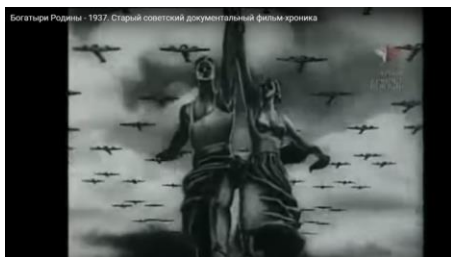
Рис. 1 (URL:

Изучая возможные источники, которые Федорченко мог использовать для своего фильма, я наткнулась на снятый в 1937 году документальный фильм «Богатыри Родины». Обнаруживается ряд поразительных совпадений в видеориторике этих двух фильмов. Перед началом вступительных титров на экране появляется посвящение фильма сталинским соколам, героям Родины и двадцатой годовщине Октябрьской революции. Эти слова, как и сами титры, движутся по экрану на фоне скульптуры Мухиной «Рабочий и колхозница», над которой кружится целый рой самолетов. Количество этих самолетов огромно, и эта картина мощно реализует главный мотив фильма: советские люди сильны как боги — у них есть крылья, они могут летать, они завоевали небо, и героем может стать каждый.