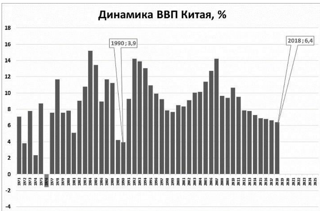
Схема 1. Динамика ВВП Китая в 1970е – 2018 год.