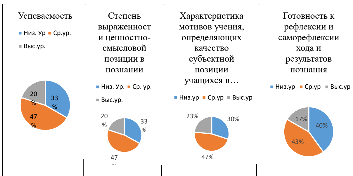
Рисунок 1 – Контрольный класс. Начало эксперимента

В экспериментальном классе этой школы на низком уровне по показателю характеристики мотивов учения, определяющих качество субъектной позиции учащихся в познании, находились у 29 % учащихся, готовность к рефлексии и саморефлексии хода и результатов познания на низком уровне составляла у 36% учащихся в данном классе, степень выраженности ценностно-смысловой позиции в познании на низком уровне была отмечена у 41% учащихся. Успеваемость находилась на низком уровне у 33% учащихся в контрольном классе и у 29% учащихся в экспериментальном классе.