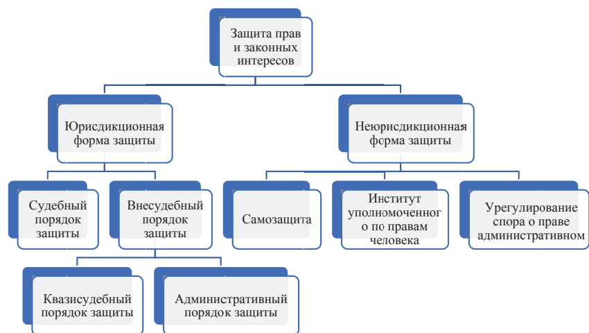
Рис. 1. Формы защиты прав и законных интересов в административном праве и процессе

б) внесудебный. Внесудебный порядок защиты, в свою очередь, представлен двумя видами процедур: квазисудебным и административным. Квасисудебный порядок защиты предполагает обращение заинтересованного лица в орган, не входящий в систему судебной власти, но осуществляющий полномочия для разрешения определенных категорий административных споров. К таким органам можно отнести Высшую патентную палату Роспатента, комиссии по рассмотрению дел о нарушении антимонопольного законодательства, квалификационная коллегия судей и пр. Административный порядок разрешения спора о праве осуществляется органами публичной администрации и местного самоуправления (Федеральный закон от 2 мая 2006 г. № 59-ФЗ «О порядке рассмотрения обращений граждан Российской Федерации»).